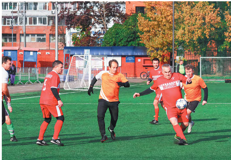
«Новая Москва» в матче с ФК «Троицк»