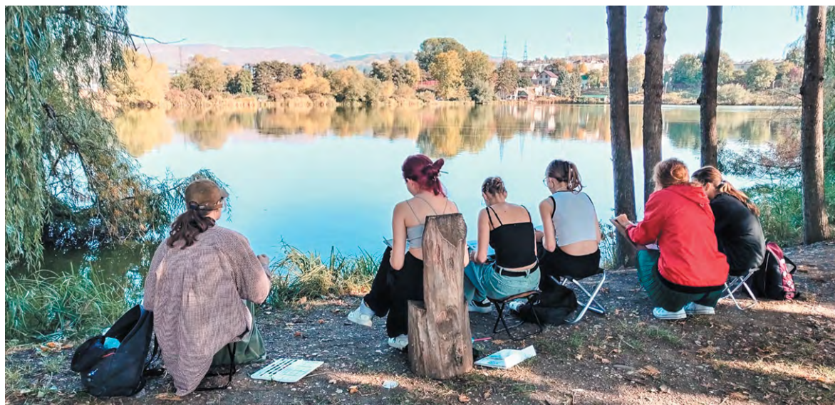
Самый первый пленэр в Кисловодске: цветные и тональные отношения воды и неба