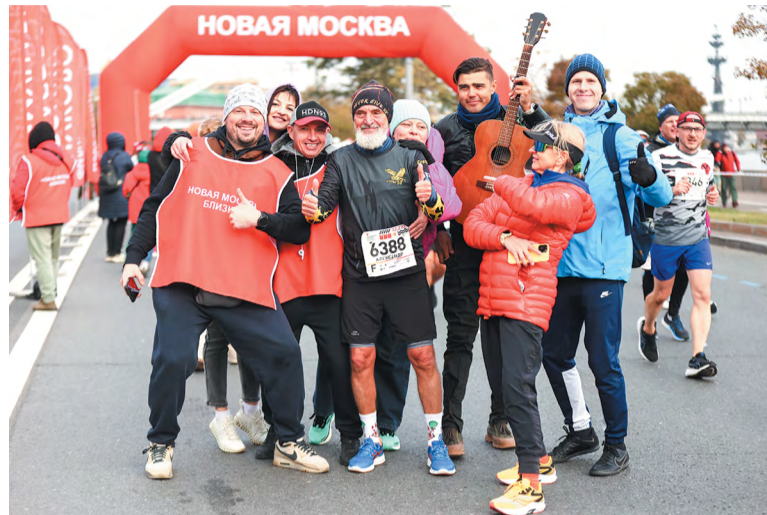
Троицкая группа поддержки придавала сил марафонцам

В воскресенье, 13 октября, в столице прошёл Московский марафон, который называют главным массовым беговым стартом страны. Протяжённость трассы 42,2 км. Маршрут проходил по всему мегаполису. Зарегистрировалось более 40 тысяч участников, из них около 30 бегунов из Троицка. И не только марафонцы приехали на соревнования в этот день из нашего города.