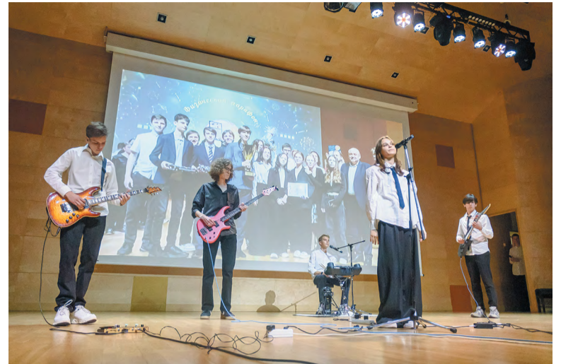
Рок-группа из 5-го отделения Гимназии