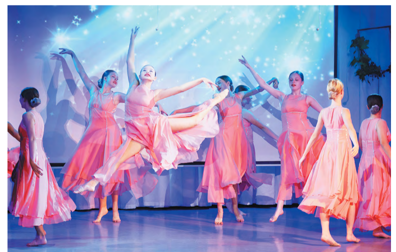
Подарок от «Фаворита»: «В поисках вдохновения»