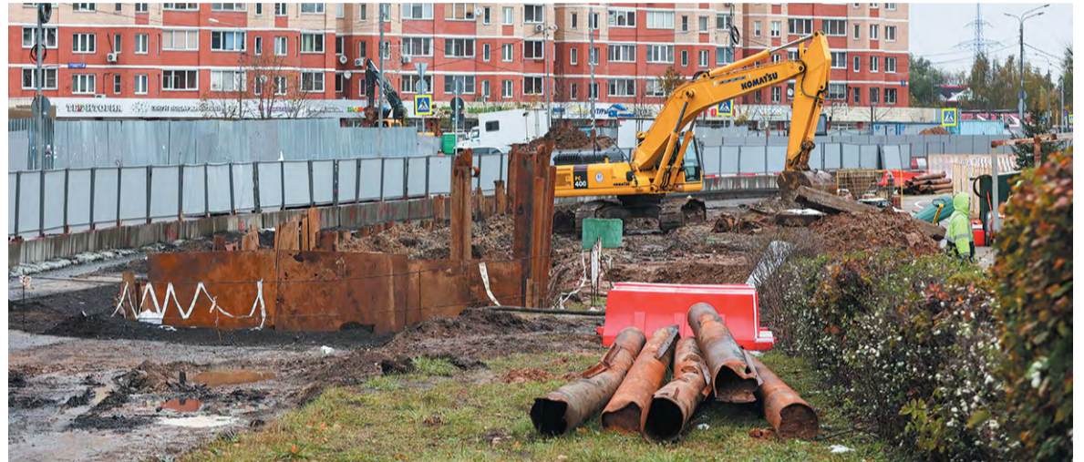
Глобальная реконструкция дорог Троицка продолжается