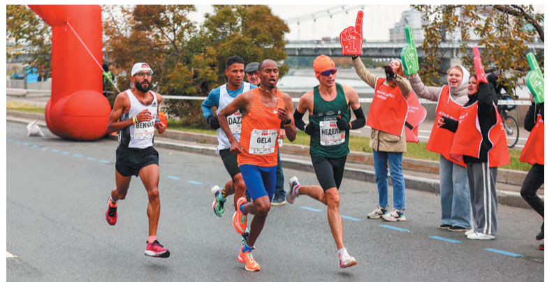
На Московском марафоне можно было увидеть участников из 14 стран