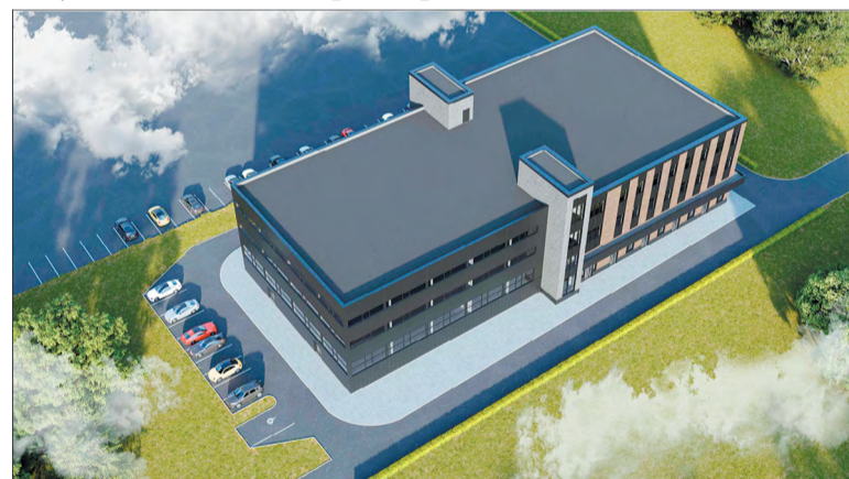
Так будет выглядеть ещё одно здание бизнес-парка

Южная часть Троицка активно развивается. Скоро на территории бизнес-парка «Аспирант» появится новое здание для научно-производственной деятельности. В минувший четверг проект обсудили на заседании Градостроительного совета.