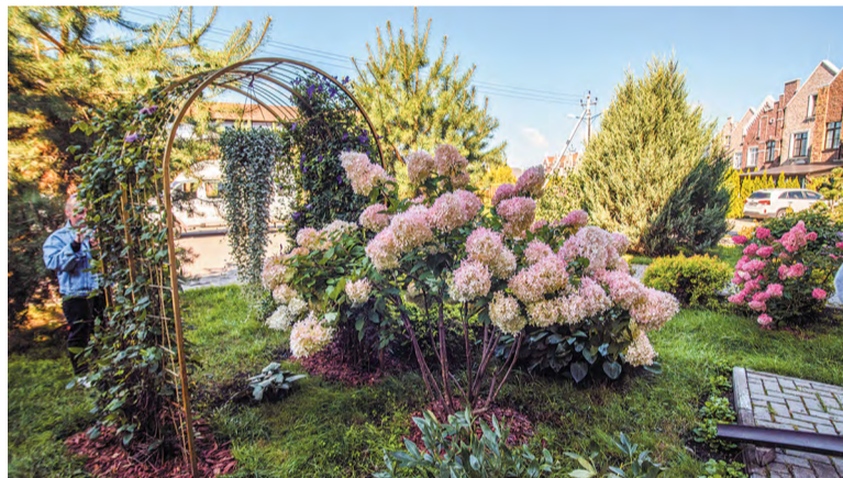
ЖК «Изумрудный». Фотозона полюбилась соседям