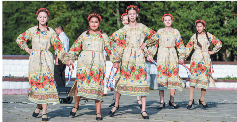
«Край родной» в исполнении ансамбля танца «Мираж»

В воскресенье в центре Сиреневого бульвара на площадке «Башенки» снова звучала музыка. На этот раз свою концертную программу подготовил ансамбль «Гуси-лебеди» Центра «МоСТ» и посвятил её Яблочному Спасу, празднику, который знаменует собой завершение лета.