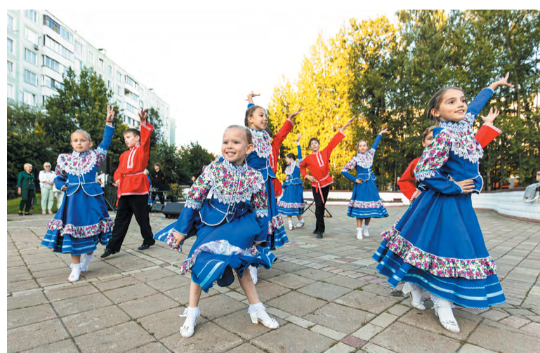
На сцене под открытым небом выступает студия «Мираж»

Только песни и танцы: день соседей на Сиреневом бульваре стал ярким летним концертом для горожан. Традиционная встреча жителей с представителями городских властей прошла в необычном формате. Программа, подготовленная Центром «МоСТ», так увлекла жителей, что они совсем забыли о своих вопросах.