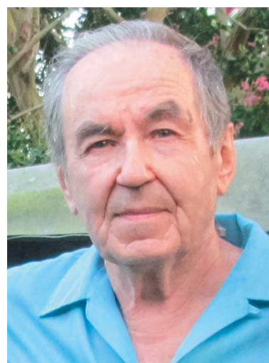
За океаном – с Троицком