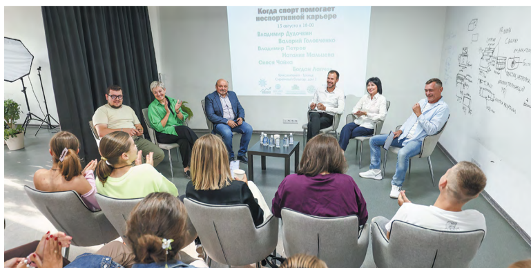
Круглый стол о жизненных ценностях