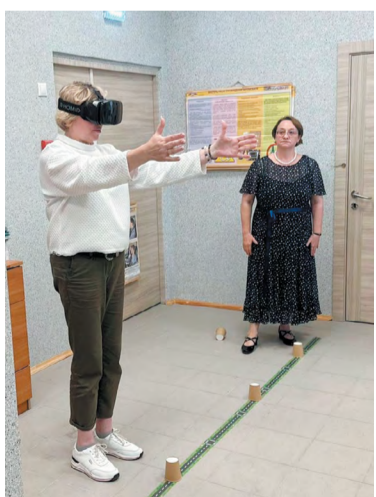
Надел очки – и словно выпил!

«Уж сколько раз твердили миру» и рейды проводили, и профилактические беседы вели, и штрафовали, и прав лишали, а воз и ныне там: по-прежнему больше всего ДТП происходит по вине пьяных водителей. Своё решение проблемы предложили кураторы социального проекта «Автотрезвость» и автошколы «Профессионал».