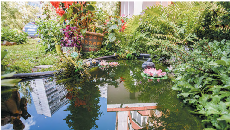
Академическая, 4. Свой прудик!

Наталья НИКИФОРОВА, фото Владимира МИЛОВИДОВА