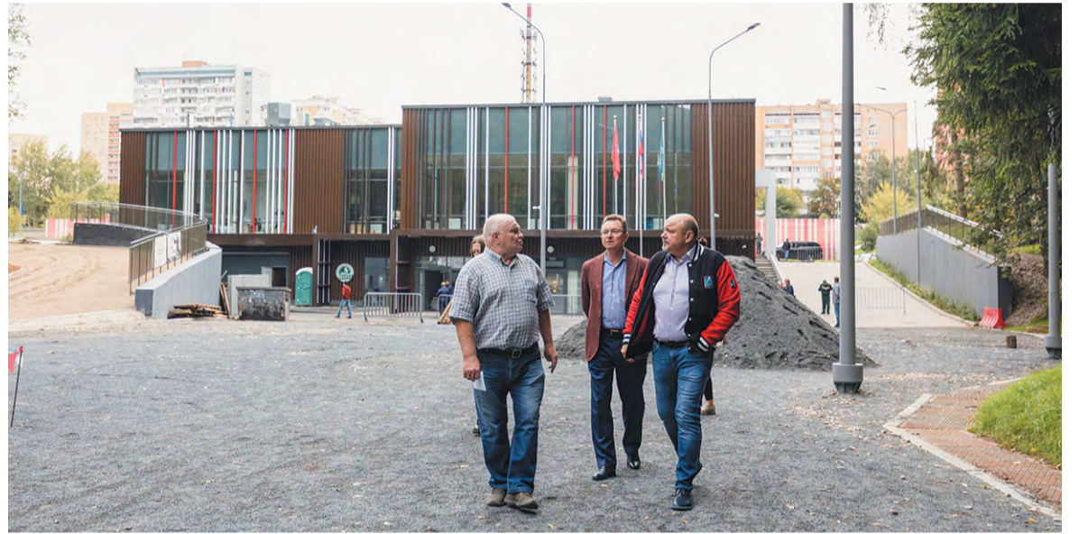
Рейд главы на этот раз состоялся на территории спортивно-оздоровительной базы «Лесная»