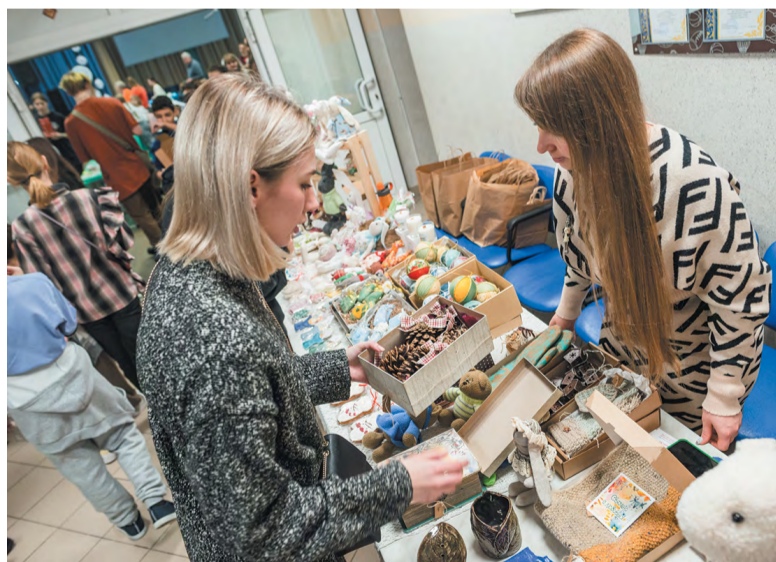
На ярмарке можно было приобрести уникальные изделия ручной работы

Благотворительная ярмарка «От сердца к сердцу» прошла во 2-м отделении Лицея Троицка 16 декабря. Масштабное событие пришло в общую копилку более полумиллиона рублей. Все собранные от продажи средства пойдут на помощь подшефным учреждениям школы.