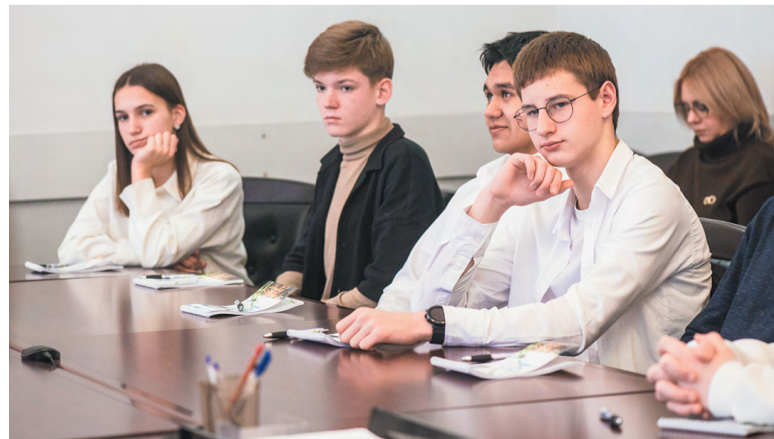
Глава города вручает гимназистам награды