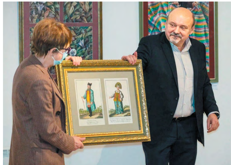
Подарок калужскому музею – картины троичского художника

Картины троичских художников сейчас на гастролях далеко за пределами Москвы и даже области. В субботу, 16 декабря, в музее изобразительных искусств города Калуги открылась выставка «Палитра наукограда».