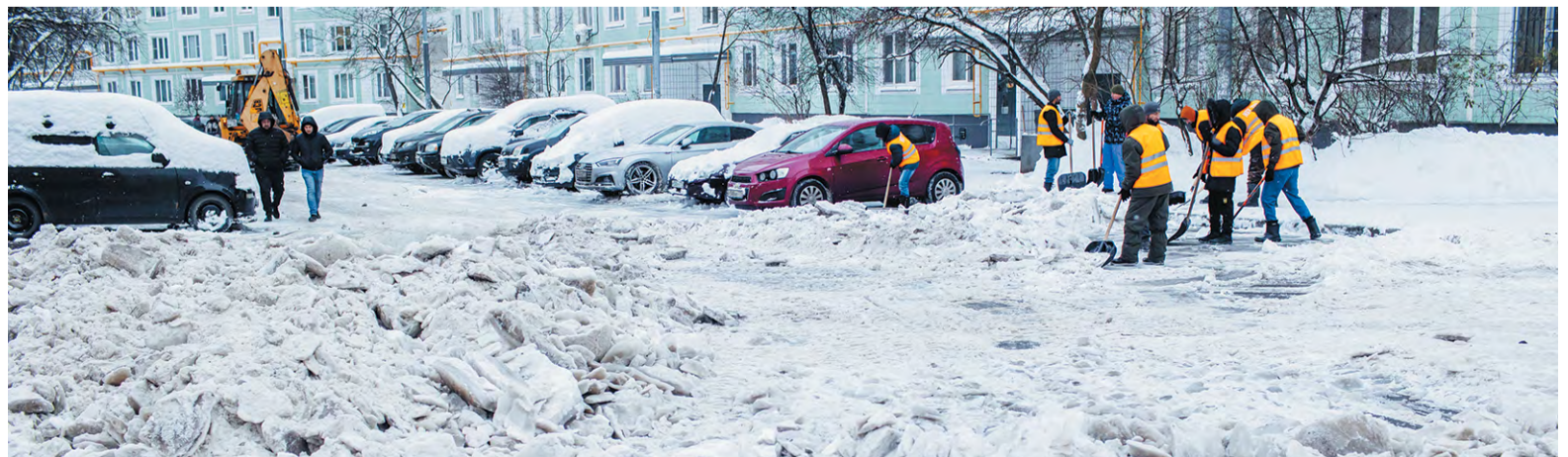
Во всех дворах работа идёт в авральном режиме. Где возможно – пускают технику. Но из-за припаркованных машин больше приходится убирать вручную

Наталья НИКИФОРОВА