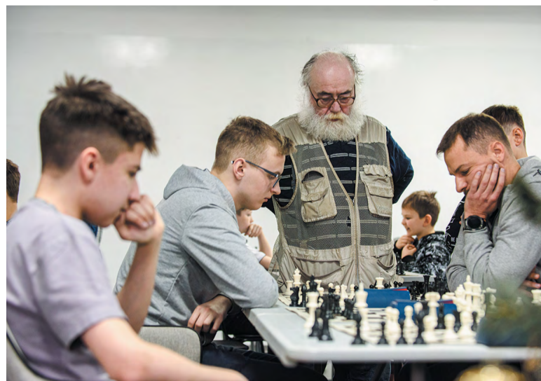
Четыре поколения шахмат в одном турнире