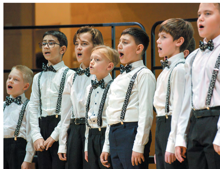
Звонкий дебют хора мальчиков