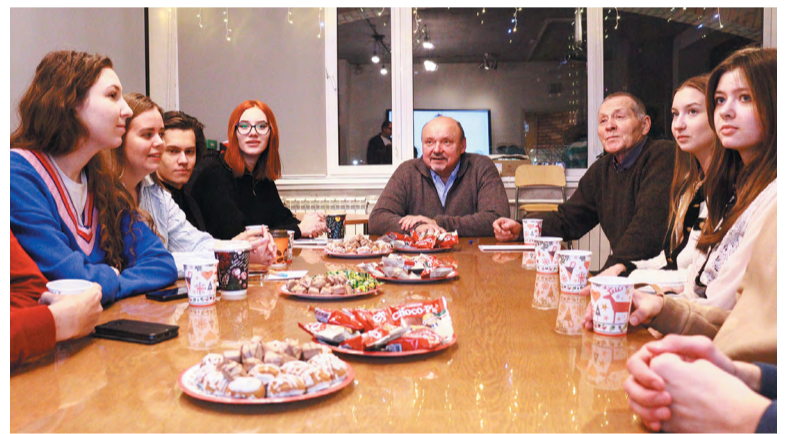
Чай и сладости – обязательные атрибуты предновогодней встречи