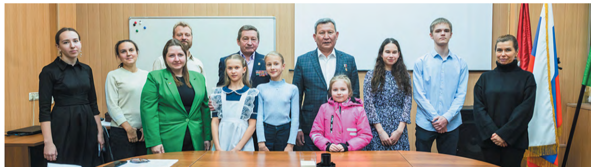
Победители конкурса «Память сильнее времени»