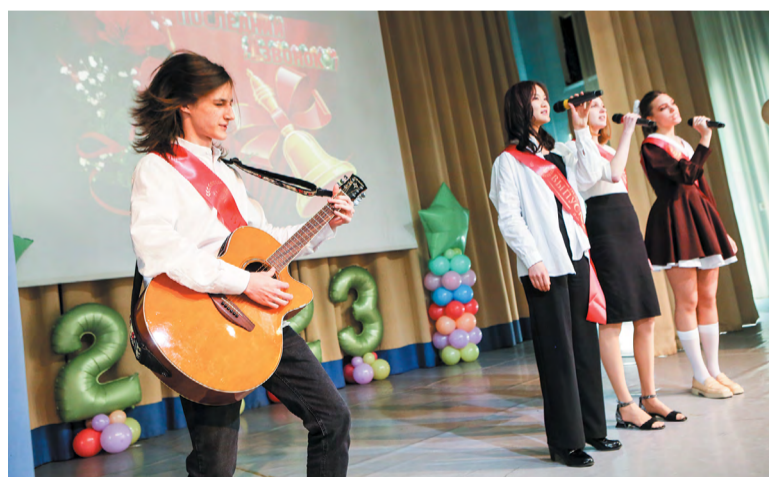
2-е отделение Лицея со школой прощалось под звон гитарных струн