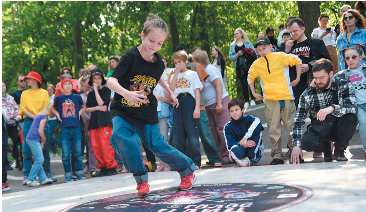
Танцпол разместился на роллердроме в парке у Десны