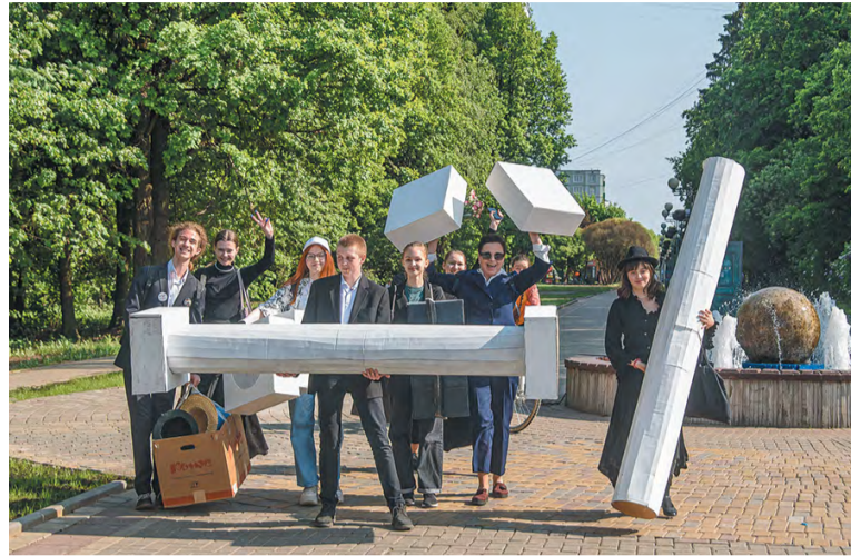
Актёры «Восхождения» пришли в Библиотеку №2 со своими декорациями

сегодняшний день у меня уже 16 картин про этого товарища. Где-то эпизоды, где-то главные роли».