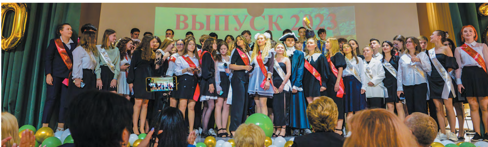
Выпускники-2023 5-го отделения Гимназии Троицка: успешные, красивые, талантливые