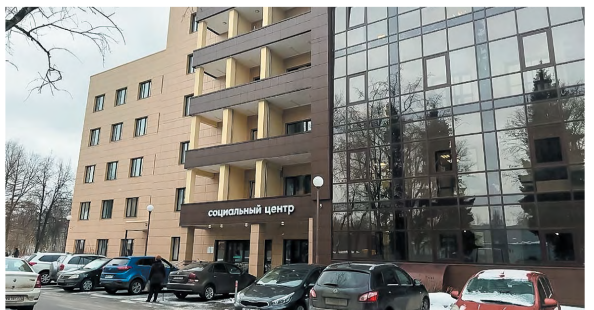
Все социальные службы города скоро соберутся под одной крышей – Пушкиных, 2а

Третье направление филиала – социальная реабилитация инвалидов. Она проводится в Троицке ещё с тех времён, когда город был в Московской области. За 10 лет в составе столицы отделение было расширено и модернизировано, последние годы оно располагалось в микрорайоне Солнечном в двухэтажном здании рядом с Троицким храмом. Теперь отделение занимает весь 2 этаж в том же доме