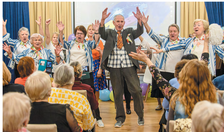
Приветственная песня нашей команды станет гимном ЦМД «Троицкий»

Но вот все в сборе. «Серебряная молодёжь – вперёд!» – тянут вверх баннер фаны из Киевского. Троицанки не отстают, размахивая метёлками и «ладошками». Звучит знакомая мелодия: «Мы начинаем КВН, для чего, для кого?..» Только вместо Александра Маслякова перед залом сотрудницы ЦМД