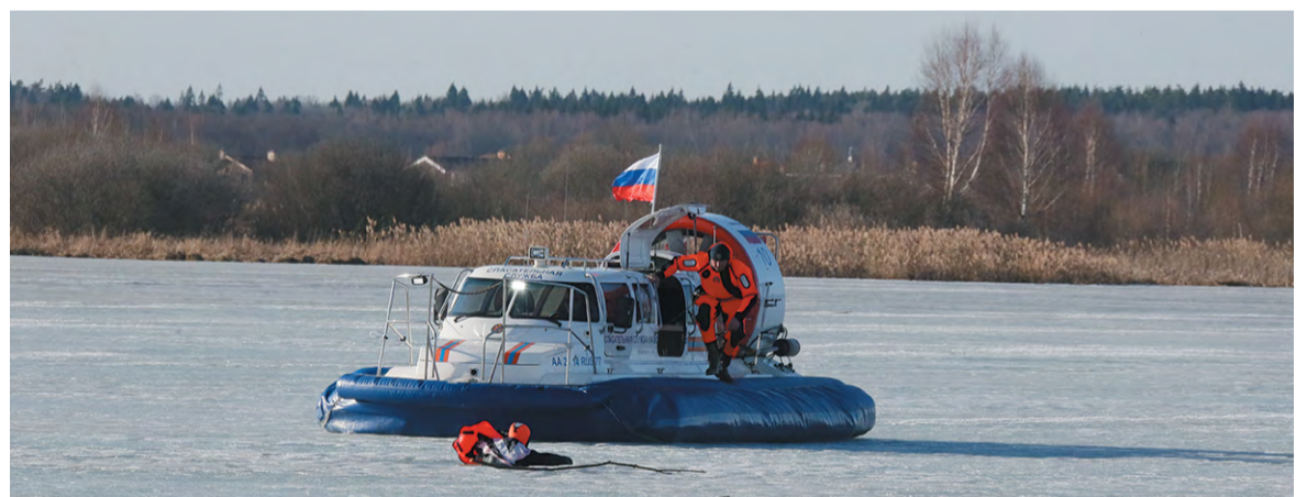
Для спасения провалившегося под лёд человека используется специальное судно на воздушной подушке

Анна МОСКВИНА