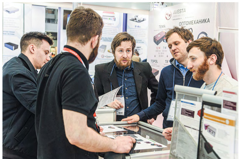
Сотрудники компании «Авеста» рассказывают о своих разработках

С 28 по 31 марта в КВЦ «Экспоцентр» (Москва) прошла XVII Международная выставка «Фотоника – мир лазеров и оптики». На её стендах были представлены НИИ и предприятия из Троицка: ФИАН, ГНЦ РФ ТРИНИТИ, фирмы «Авеста», «Оптические системы», группа компаний «ТехноСпарк» и новички – Soliton Photonics. Параллельно прошёл Конгресс российской технологической платформы «Фотоника», в одной из секций которого выступили учёные ФИАНа.