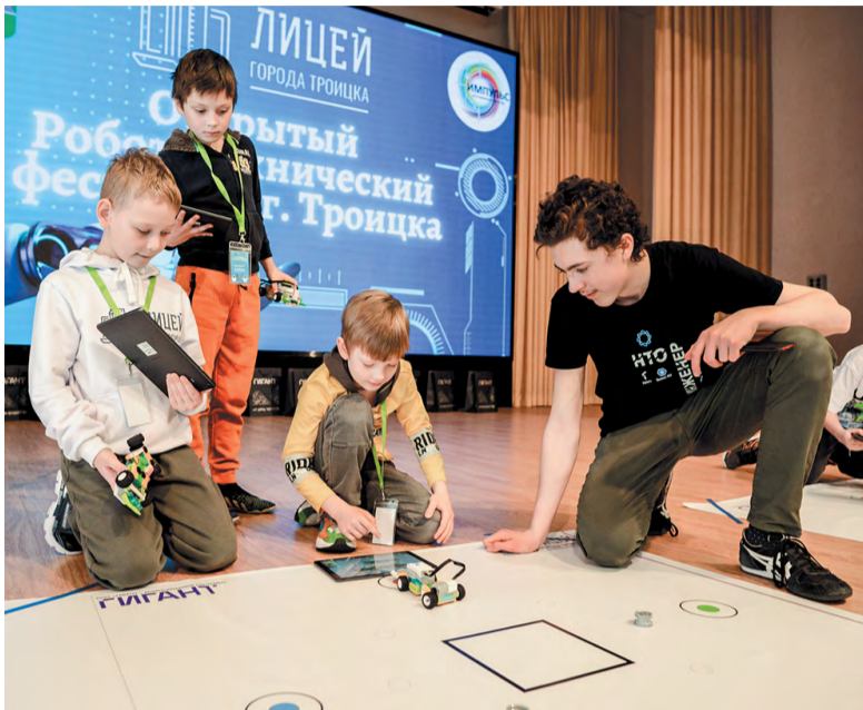
«Робофишки» – конкурс для самых юных участников фестиваля

Открытый робототехнический фестиваль прошёл в начальном отделении Лицея в субботу, 1 апреля. Участвовали школьники Лицея и Гимназии Троицка. Были организованы три станции для конкурсантов разных возрастов. Ученики начальных классов пробовали свои силы на площадке «Робофишки», пятиклассники и более старшие ребята участвовали в конкурсах «Лабиринт» и «Кубок РТК мини».