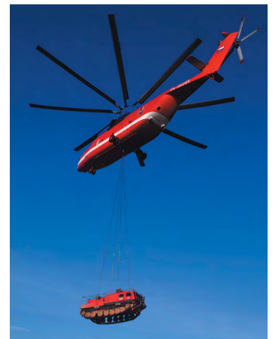
Вертолёт незаменим для МЧС

А на берегу пруда уже действует инженерный отряд, в который вошли специалисты «Автомобильных дорог», «Мосгаза», Гормоста и других организаций. Они очищают от воды подтопленные территории, восстанавливают дороги, строят мосты и переправы, создают водоотводы и водозащитные дамбы. Сотрудники «Россети Московский регион» и ОЭК приступают к своей части работы: восстанавливают электроснабжение в пострадавших от паводка населённых пунктах. «В столичном регионе идёт активное таяние снега, проводятся мероприятия по организации безаварийного пропуска паводка, на водохранилищах продолжается планомерный сброс воды для приёма талого стока», – пояснил Пётр Бирюков. – Под особым контролем находятся места возможных подтоплений, принимаются меры по недопущению нарушений жизнеобеспече-