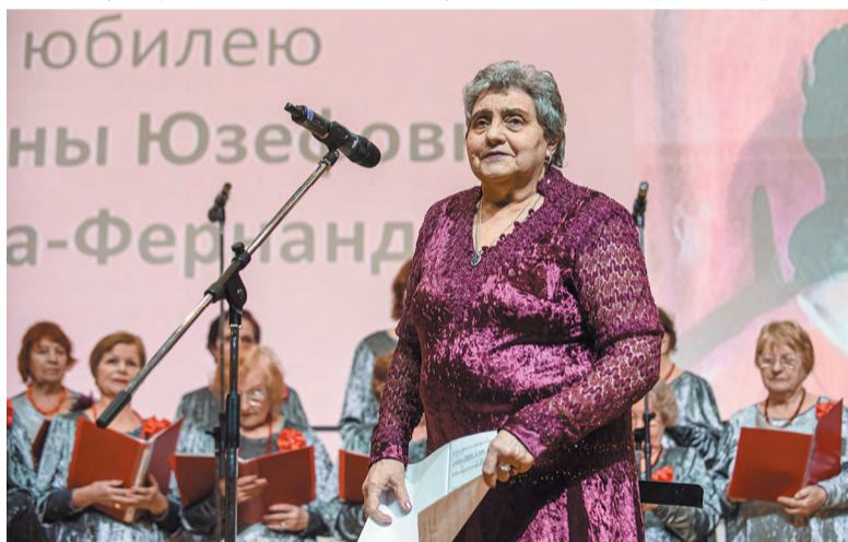
Троицкий хор ветеранов завершает юбилейный вечер