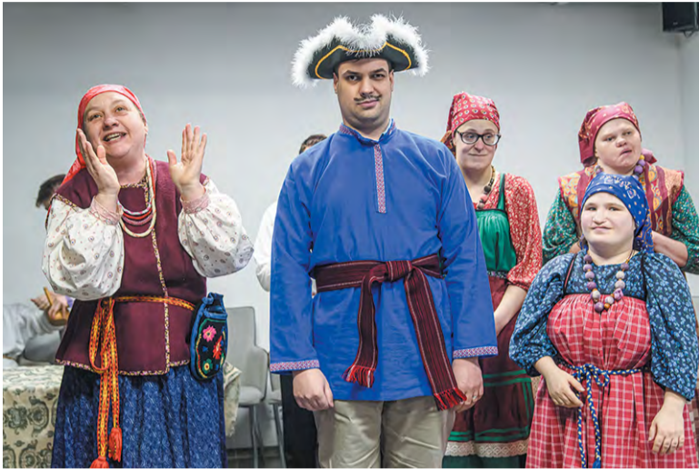
Пётр I и его подданные из Дома слепоглухих в Пучкове

Государь-император Пётр I вернулся из дальних странствий. Прорубил окно в Европу и похудел, подустал. Верные подданные встречают его хлебом-солью, а он вручает им подарки: странные заморские зёрна, на цвет чёрные, на запах чудные. Что же с ними делать? Такова завязка пьесы «Пётр I и кофе», которую год назад поставил инклюзивный театр Дома слепоглухих «Видящие сердцем». Её не раз показывали в родных стенах, на выезде, на празднике «Алые паруса» на берегу Десны, а вот как отдельный спектакль в Троицке сыграли впервые 31 марта в «Точке кипения».