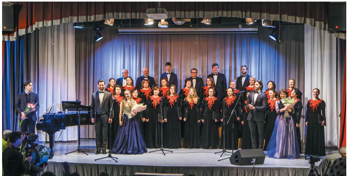
Цветы – Троицкому камерному хору. Благодарность – Сергею Рахманинову