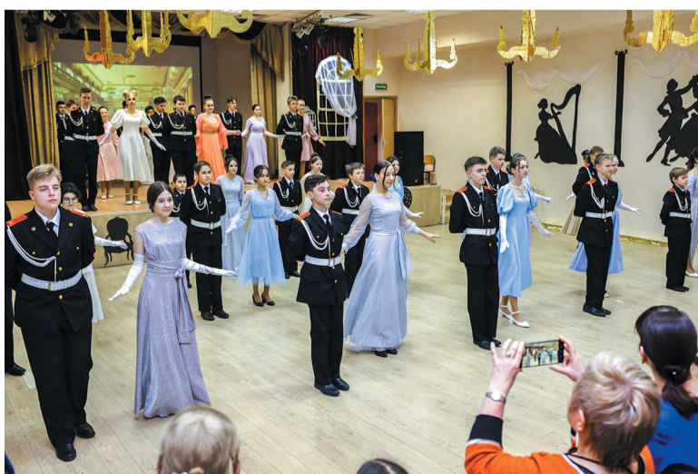
Троичские гимназисты перевоплотились в кавалеров и дам