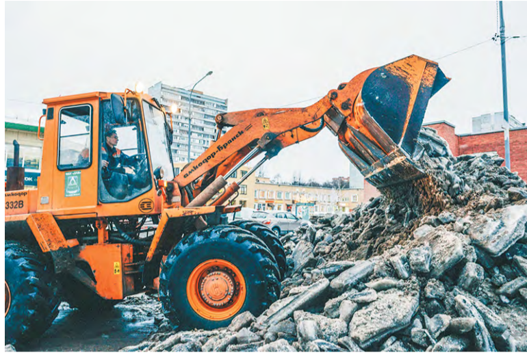
Интенсивная уборка от снега и льда идёт во всех районах города