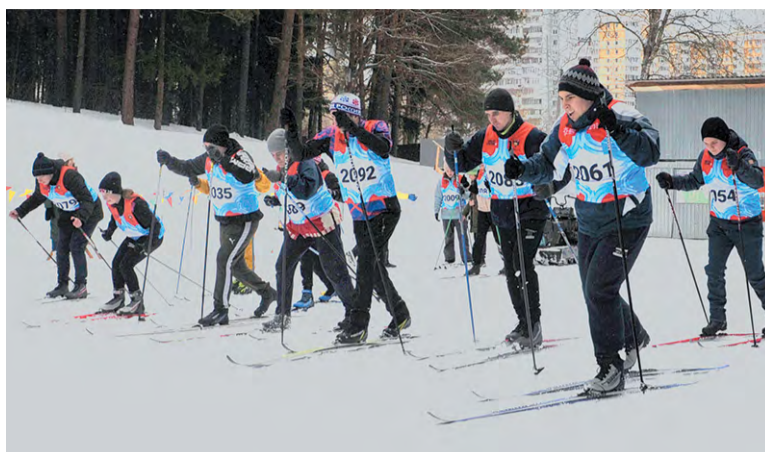
Для тех, кто увлечён спортом, нет преград!