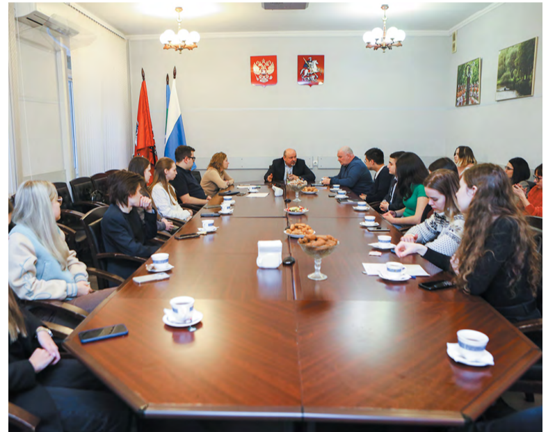
Троицкая Молодёжная палата встретилась с главой города

У молодых активистов действительно большой опыт общения с жителями. Они проводили акцию против курения, помогали организовать игры для проекта «Наш двор. Добрые соседи», устраивали игры в «Мафию» в Выставочном зале. Но не только развлечениями занимается Молодёжная палата. Сейчас она помогает Троицкому гуманитарному центру. Самым