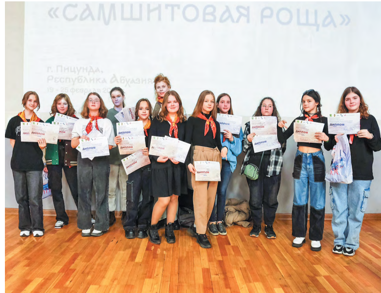
Дипломов у троицан оказалось немало

Члены жюри высоко оценили работу воспитанников ТДХШ: