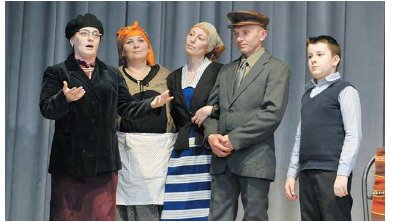
«Арлекин+» из Красной Пахры: «Сельские жители» Василия Шукушина