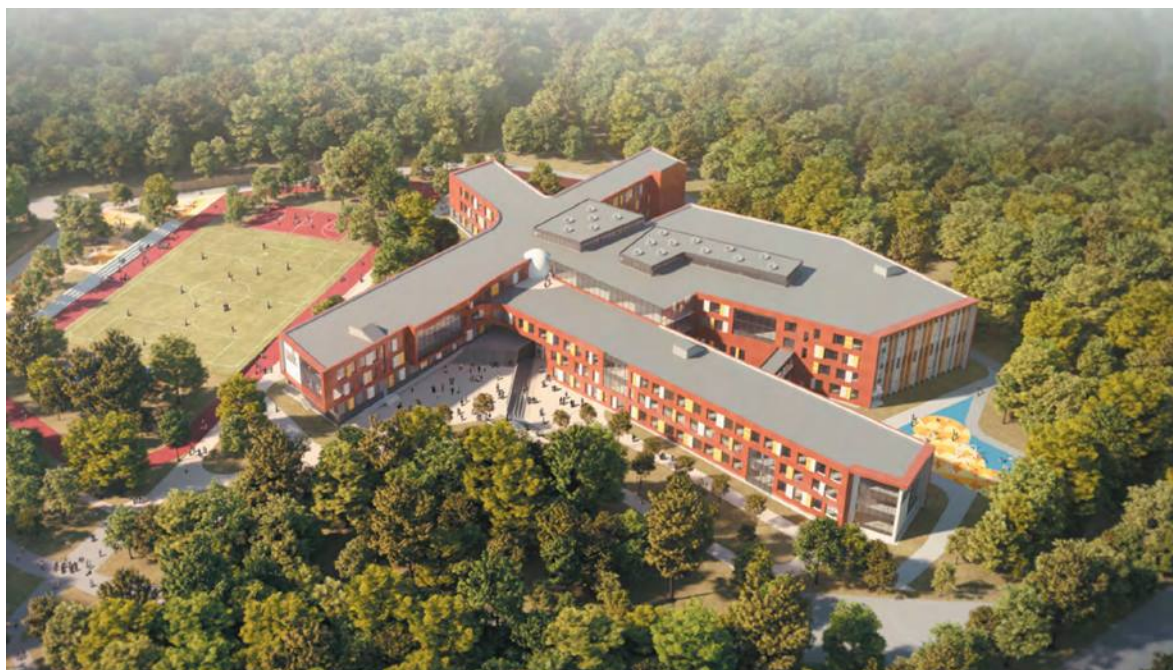
Самый главный проект Троицка – школа на 2100 мест. Строительство началось