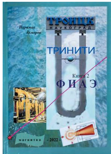
Второй том книги о ТРИНИТИ

Твёрдая обложка, 544 страницы, множество чёрно-белых фотогра-