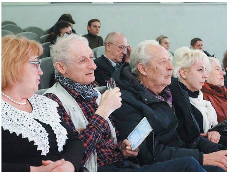
Встреча с активистами Советов домов Троицка прошла в Центре «МоСТ»

Планы по благоустройству, аварийные работы по замене коммуникаций, организация вывоза мусора, правила выгула собак. Все эти вопросы обсудили на встрече с председателями Советов домов. Она прошла в Центре «МоСТ» 14 апреля. Также старшим по домам сообщили, что теперь они могут получать льготы за свою работу: им положена жилищная субсидия.