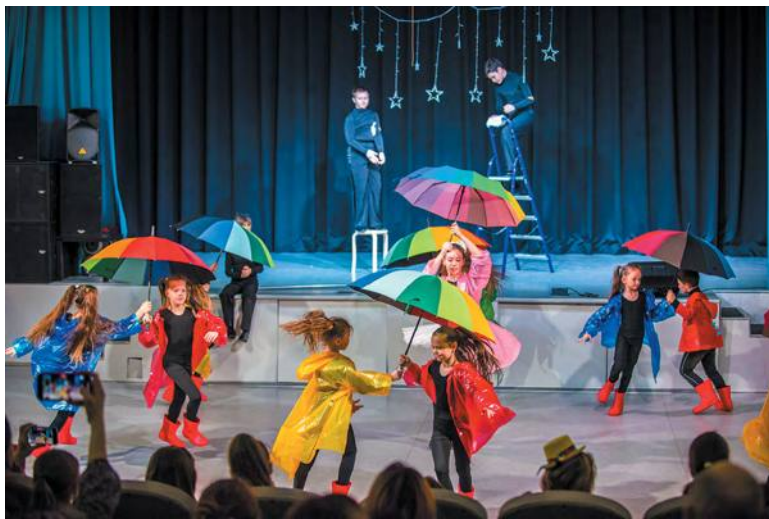
В Троицке теперь есть свой мюзик-холл

Одна из таких идей – в самом начале выступления. Два мальчика – со шваброй и тряпкой в руках – протирают развешенные над сценой звёзды. «Ты что, опять проспал?» – «Ты чего: проспал, я вчера ночью целых два созвездия почистил!» – «А я вот сейчас Млечный путь чищу. Давай, присоединяйся!» Сценка обрывается вторжением «тучек» – малышей в разноцветных плащах, в танце изображающих дождик. «А я новое созвездие придумал», – продолжает парень на сцене. «Где?» – «На Земле! Там тоже маленькие