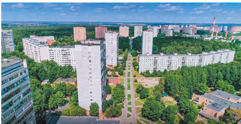
Запомним нынешний вид Сиреневого бульвара. Скоро перезагрузка!

Алексей МАКАРОВ