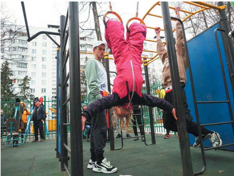
На тренировку пришли жители всех возрастов

Действительно, всего за один час тренер программы «Мой район» провёл разминку для всех собравшихся, а также показал целую программу тренировок, адаптированную для разных возрастных категорий. Люди получили мощный заряд бодрости, изучили упражнения, которые помогают держать организм в тонусе и укрепить сердечную мышцу.