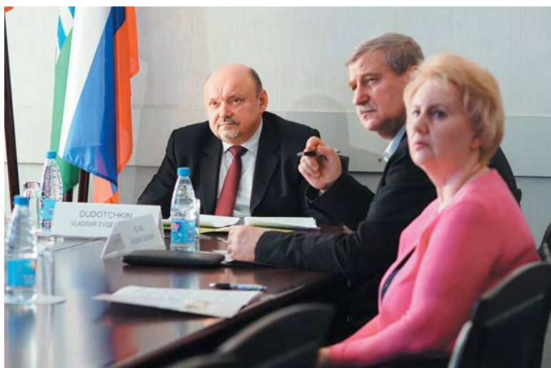
Онлайн-конференция: Троицк – Хошимин