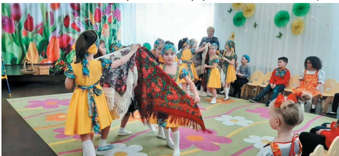
Танец с шальями родителям в подарок

Жанна МОШКОВА