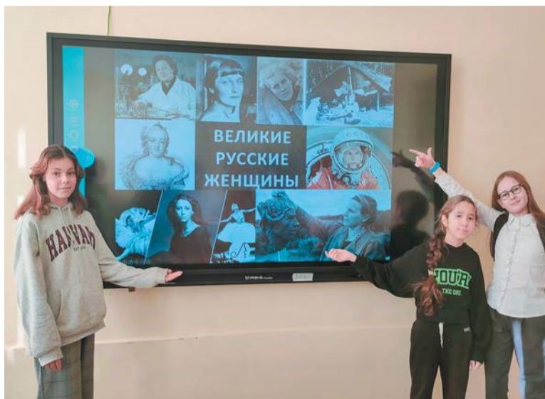
От царицы Елизаветы до космонавта Терешковой

«Елизавета Петровна. Умная, справедливая. Правила, улучшала, просвещала. Она сделала страну лучше. Справедливость!» –