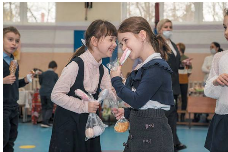
Ярмарка в Начальной школе: вкусно, весело, с размахом

Первая такая ярмарка прошла 10 лет назад, когда Начальная школа вселилась в новое здание. Те, кто были первоклашками тогда, теперь уже оканчивают учёбу. И старшеклассники, ученики Лицея, часто заглядывают сюда