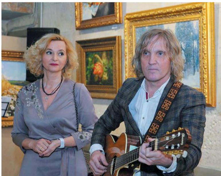
В Троицк приехали ученики Ильи Глазунова