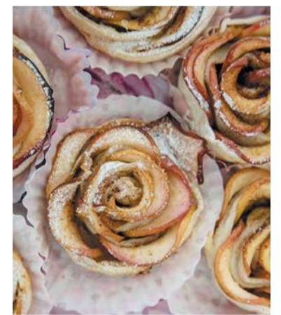
Яблочные розочки ручной работы

А вкусно – глаза разбегаются. Тут и блины, и пироги, и выпечка на любой вкус. В Началке занимают первые четыре класса, в субботу у них учебный день, и классные руководители заводят своих подопечных по очереди, чтобы не создавать толкотни. Оглядев прилавки и выбрав то, что нравится, ребята уходят с пакетиками, полными угощений. Для многих это, возможно, ещё и первый опыт обращения с деньгами, который пригодится, когда ребёнок пойдёт за покупками в настоящий магазин.