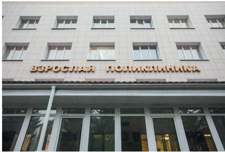
Поликлиник в городе станет больше