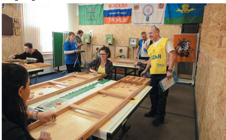
Соревнования с весенним настроением