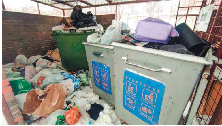
Контейнеры переполнены. Жители недовольны

Горы мусора. Контейнеры под завязку забиты отходами. Повсюду на земле разбросаны пакеты. Такую картину можно было наблюдать в первые дни нового года практически в каждом дворе. Начиная с 4 числа мусорные машины стали курсировать по городу. Частично от мусора избавились, но в целом проблема так и не решена.