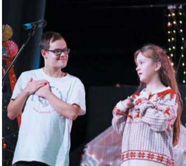
Спектакль, сыгранный с душой

«Рождественское приключение: удивительная история Вани и его друзей» – премьера этого спектакля состоялась 16 января на сцене Троицкой православной школы. Подготовили его воспитанники пучковского Дома слепоглухих. В холле они открыли благотворительную ярмарку изделий ручной работы. Угощали всех сладостями и чаем, а потом пригласили в зал, где и показали новый спектакль.