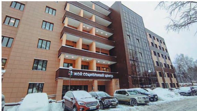
Судьба здания на улице Пушкиновых решилась в пользу троичан