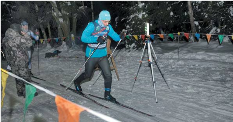
Особая романтика лыжной гонки по тёмному лесу

Солнце село, на термометре минус 12 градусов, ветрено. Но любители лыжного спорта утверждают, что такая погода как раз подходит для спринта – забега на короткую дистанцию: замёрзнуть не успеваешь, а ветер в спину только помогает набрать скорость. В минувшую среду, 12 января вечером, лыжники собрались на спортбазе «Лесной» близ ботаковского поля на старте квалификационных забегов первенства Троицка по лыжным гонкам в спринте. Взрослым предстояло бежать один километр, детям – 500 метров. Участники – спортсмены 21 возрастной категории. Вначале на лыжню выходят самые маленькие, а уже совсем под вечер старт для взрослых.