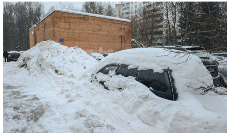
Шарада для водителей: найди свой автомобиль