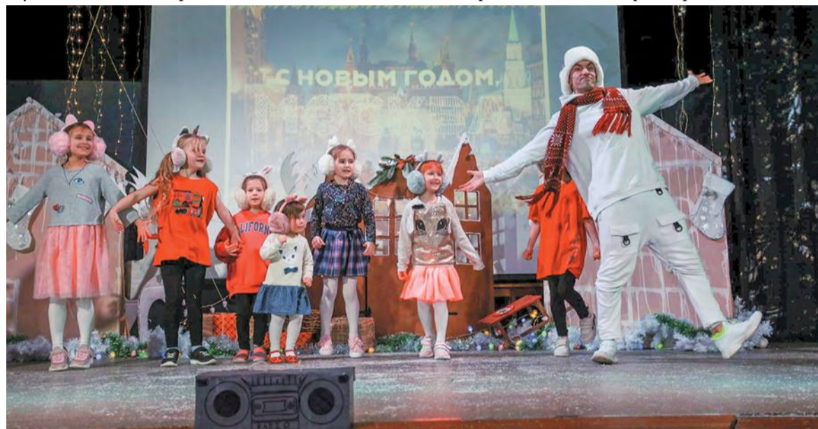
Сразу со всеми прошедшими праздниками поздравили самодельные артисты Дома слепоглухих