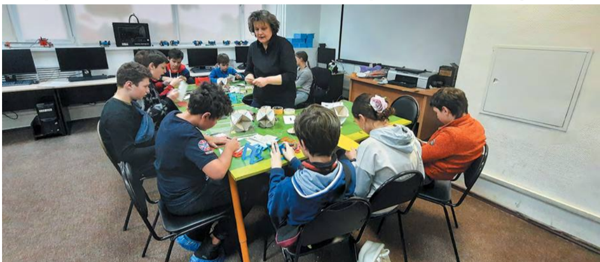
Школьникам «Байтик» предлагает самые разные занятия