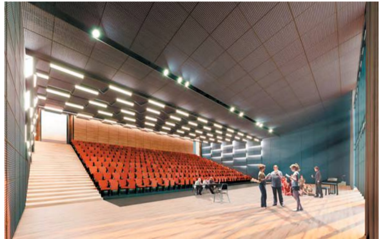
В новом корпусе места хватит на всё, даже на школьный кинотеатр

Проектом предусмотрено размещение бассейна, трёх совре-