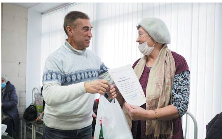
Грамоты и награды вручили самым активным участникам «Движения»

Около 400 человек состоят в троицком Обществе инвалидов. Они ведут активную жизнь: выезжают на экскурсии, участвуют в соревнованиях, вместе проводят праздники и каждый год в начале января собираются, чтобы поздравить своих юбиляров.