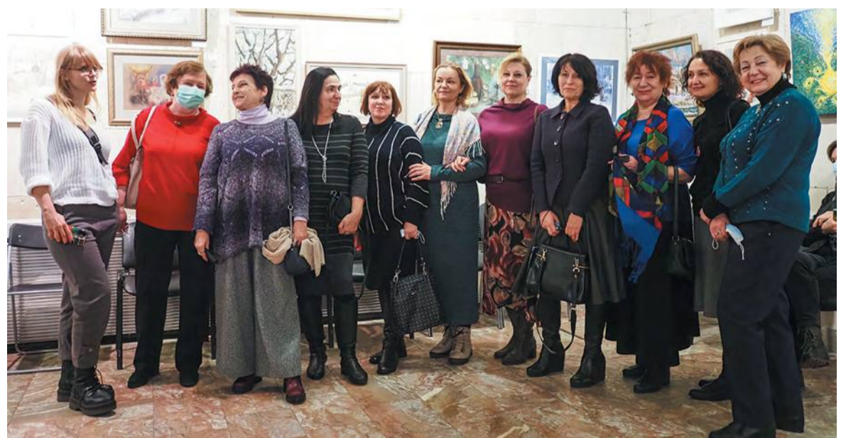
Содружество художников Троицка. Их зимняя выставка открывает череду грядущих вернисажей

Светлана МИХАЙЛОВА