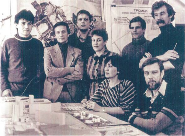
Команда профессионалов КПМ-11 в годы бурного развития Троицка

Комплексная проектная мастерская №11 ГИПРОНИИ АН СССР, в стенах которой создавался Троицк, в прошлом году отметила своё 45-летие. Генплан города, планировка его улиц, проекты большинства зданий выполнены сотрудниками КПМ-11. Однако история организации завершилась на отметке 45: в 2021-м мастерская прекратила свою деятельность. Осталось только вспомнить её славный путь и поблагодарить коллектив за город, в котором живём.