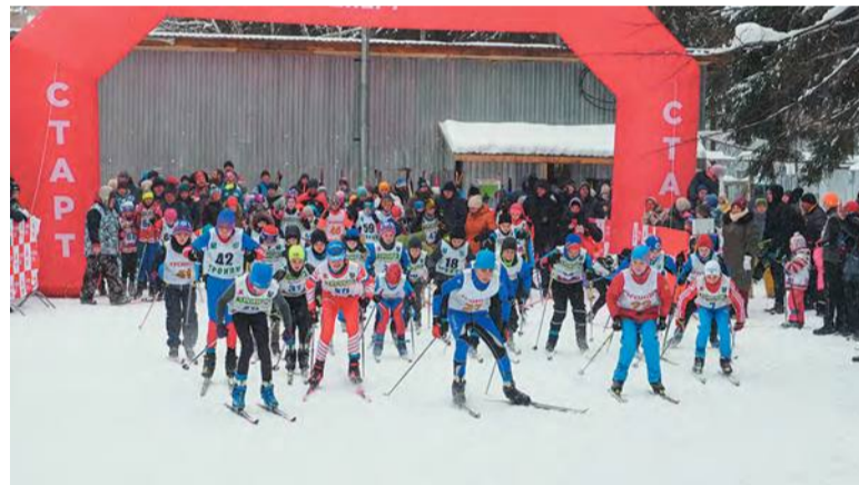
На базе «Лесной» состоялись первые в новом сезоне лыжные гонки