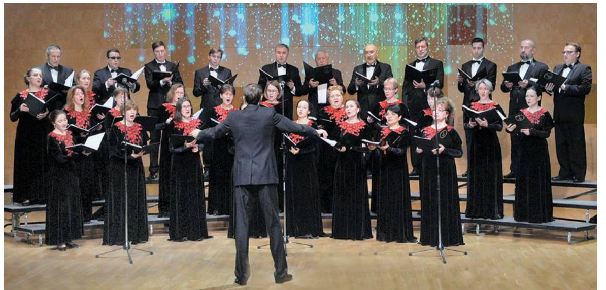
Троицкий камерный хор с программой «Вечером синим»