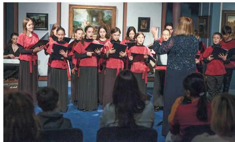
Хор «Настроение» принял участие в мировой премьере