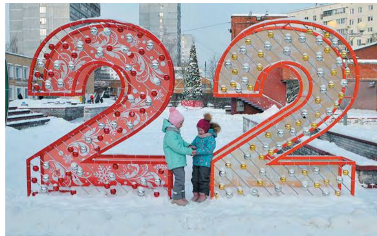
У Сиреневого бульвара новогодний наряд

Чем запомнился год уходящий? Прежде всего тем, что понемногу мы приспособились к нынешней реальности, осознали, что с коронавирусом нам ещё долго придётся бороться, а потому – будем жить по-новому, пересматривая не только планы, но и принципы организации работы.