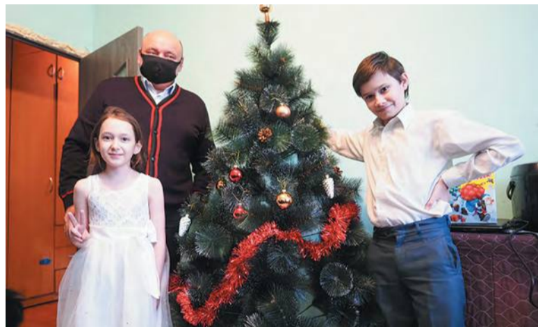
Глава города подарил ёлку маленькой Снежане

Светлана МИХАЙЛОВА