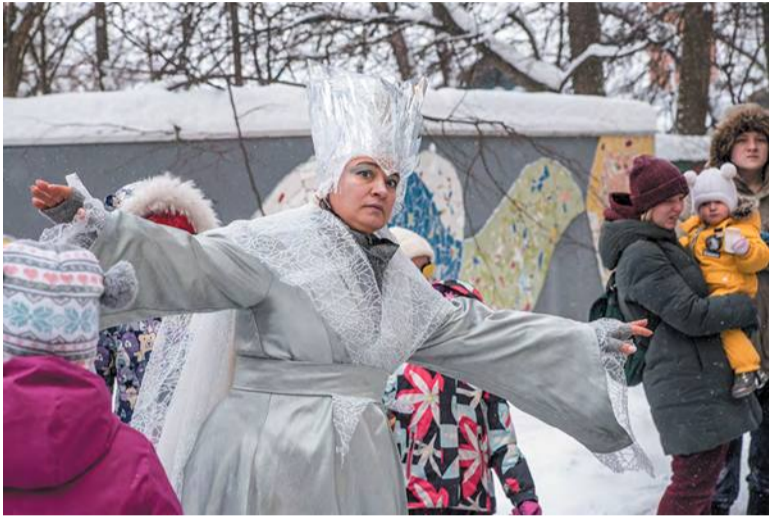
Кто растопит сердце Снежной королевы?

По Троицку вдоль по улице Лесной идёт женщина в белых одеждах, с короной на голове. «Ууууу! – грозно покрикивает она. – Заморожу!» Но детишки почему-то её не боятся и гурьбой бегут вслед, а самые смелые – придерживают длинные полы её наряда. Это арт-фестиваль «Снежная королева на Козьей тропе», который провёл 26 декабря в Троицке центр «Креативная среда».