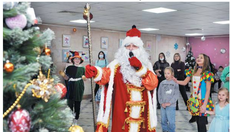
Дед Мороз из ТЦКТ поздравляет детвору с Новым годом