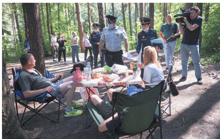
Семейный пикник в лесу разрешён. Но только без костра!

Светлана МИХАЙЛОВА