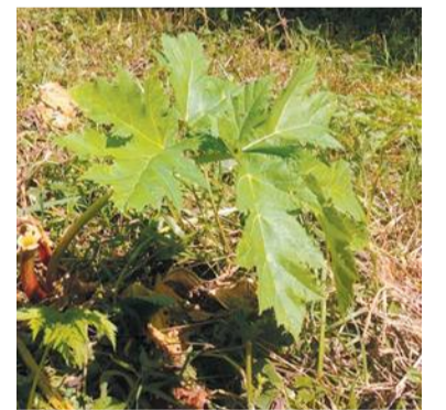
Борщевик в Троицке. Юбилейная, 5