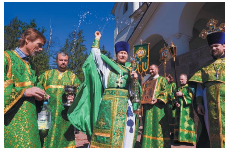
Благословение на Троицу