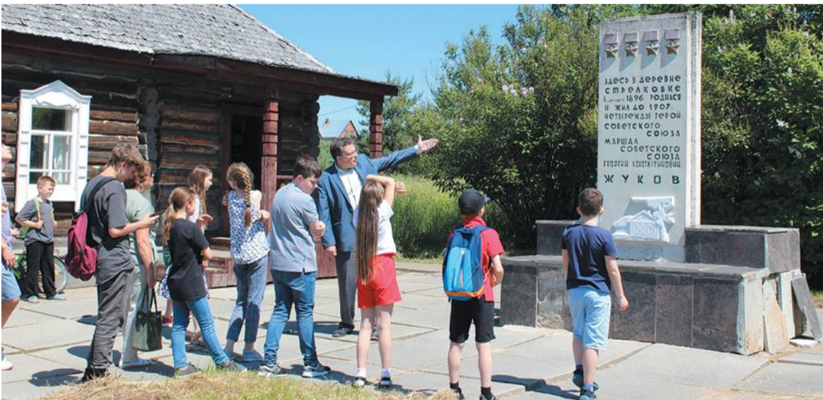
На Родине маршала Жукова. Деревня Стрелковка. Июнь, 2021 год