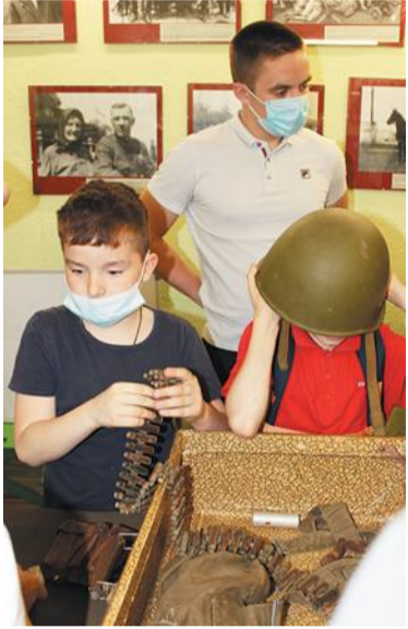
Музей в Кремёнках. Живая история

Как объяснить детям, что такое война? Одного рассказа недостаточно. А вот если побывать в местах, где шли бои, примерить каску, в которой 80 лет назад сражались солдаты, постоять на высоте, которую немцы пытались занять, но так и не смогли, – вот тогда память о войне останется надолго и появится желание больше узнать о событиях тех времён.