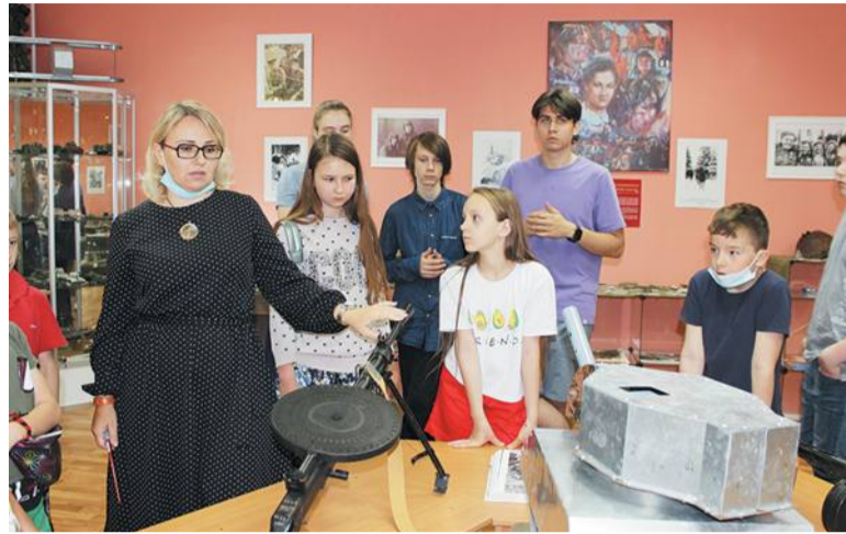
Экспозиция в школе №2073 посвящена 80-летию битвы под Москвой

Часть экскурсии – посещение деревни Стрелковка, что в трёх километрах от города. Это родина Жукова, сейчас здесь находится реконструированная родительская изба полковника. Настоящий дом сожгли немцы. В 1975 году в