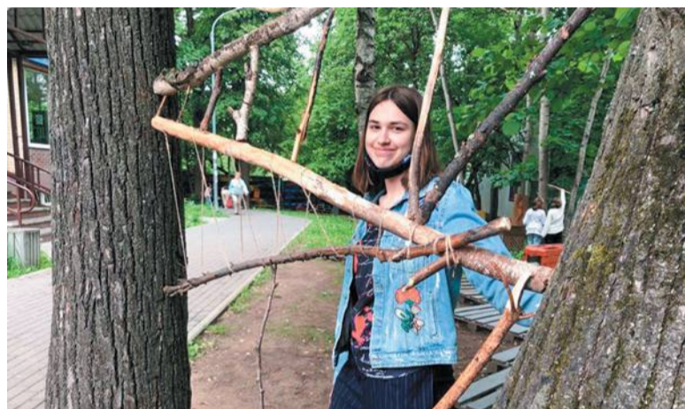
Рукотворная паутинка. Арт-объект студии «Креативная среда»