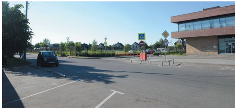
Сейчас стоянка возле МФЦ выглядит так

Дошло до того, что пассажиров начали высаживать прямо на проезжей части. Руководство Мосгортранса заявило: если городские власти не наладят движение на этом участке, движение общественного транспорта по Изумрудной прекратят.