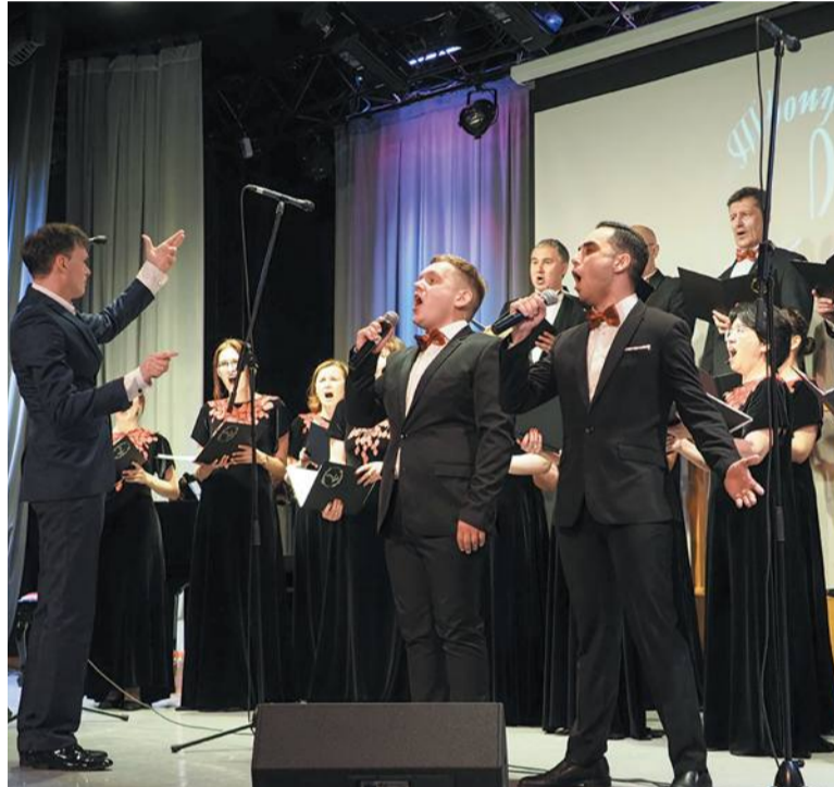
Заключительный номер концерта – знаменитая «Смуглянка»