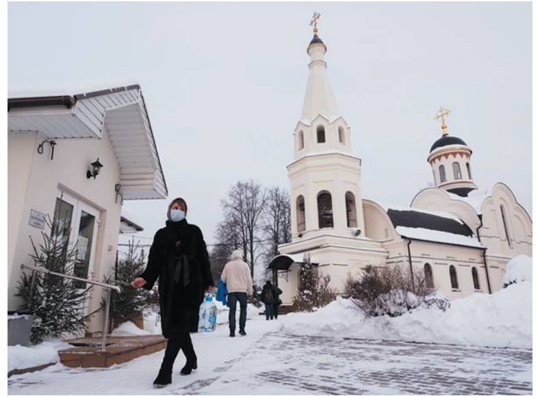
В Тихвинский храм – за святой водой

Люди воцерковлённые специально готовятся к этому празднику, как к любому другому. «Служение литургии предполагает