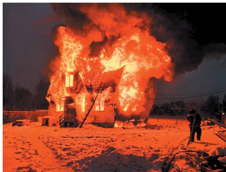
Пожар по соседству, в деревне Верховье поселения Первомайское

С 1 января этого года в силу вступила новая редакция Правил противопожарного режима. Особое внимание в них уделяется эксплуатации подвалов, цоколей и общих коридоров на этажах: запрещается хранить коляски, велосипеды, санки, мебель и другие личные вещи. «К сожалению, в многоквартирных домах практически на каждом этаже в коридорах устраивают кладовки, – рассказывает начальник 2 РОНПР. – Люди думают, что место для прохода остаётся и ничего страшного в этом нет. Но когда в соседней квартире происходит пожар, подразделение в боевом снаряжении, которое, кстати сказать, очень громоздкое, эвакуирует людей, потом несколько человек начинают тушить возгорание... Им приходится расчищать путь, раскидывая всё, что стоит в коридоре. На это уходит время и это создаёт большие препятствия для спасателей». Другая сложность – если что-то загорится в коридоре. Можно оказаться в опасной для жизни ловушке, эвакуироваться из пожара будет невозможно.