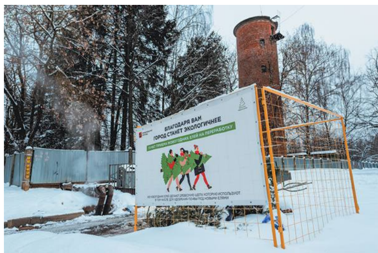
Пункты приёма заметны издалека по ярким плакатам

Праздники закончились, но выбрасывать новогоднюю ель на свалку не стоит. Сухое дерево можно отправить на переработку. Пункты приёма елей, пихт и сосен в рамках акции «Ёлочный круговорот» работают по всей столице. В Троицке восемь таких точек. Они расположены на контейнерных площадках для раздельного сбора отходов.