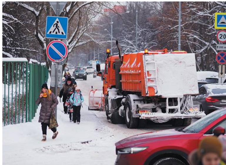
Припаркованные автомобили часто мешают механизированной уборке