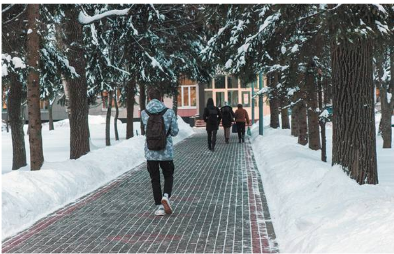
Учащиеся Лицея тоже соскучились по педагогам и друг по другу

Больше трёх месяцев ученики с шестого по 11 класс получали знания дистанционно. 18 января образовательные учреждения возобновили очную форму обучения. Вернулись за парты и тропические школьники.