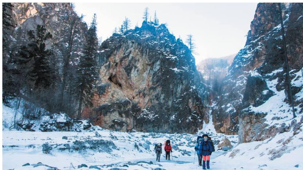
«Казалось, вся моя жизнь прошла на этом склоне...»