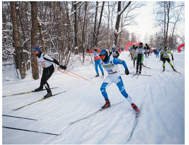
17 января, соревнования в Вороново, у Троицка I место в командном зачёте

Условия для тренировок спортсменов создаются. Так, в конце 2020 года на городском стадионе появилось профессиональное освещение и оградительные сетки. Для тех, кто занимается индивидуально, предусмотрено дежурное освещение. «Продолжаются работы по освещению баскетбольной, волейбольной и скейт-площадок на стадионе, – рассказывает Сергей Мискун. – К началу летнего сезона планируется отремонтировать площадку для скейтбордистов. В «Кванте» заменено покрытие в большом зале». Создан проект, согласно которому на базе «Лесной» появятся