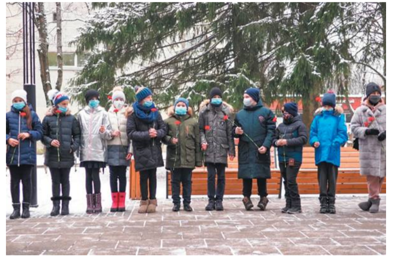
Школьники возложили цветы к обелиску на площади Академика Верещагина