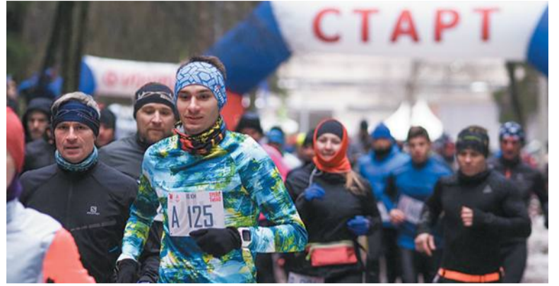
Спортивная база в Троицке – одно из самых популярных мест города

Предпроектное решение готово, но есть проблемы. Одна из них – установка освещения: в лесу это сделать сложно. Под землю кабель не уберешь: мешают корни деревьев; по воздуху – есть опасность обрывов при падении аварийных стволов. Надо решить и вопрос безопасности. В первую очередь это касается использования оборудования: часть элементов придётся огораживать забором. Нельзя забывать и о вандалах. С ними будут бороться с помощью видеонаблюдения и охраны.