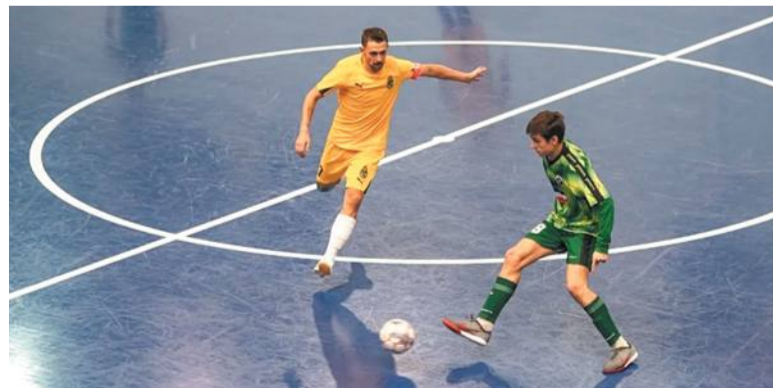
«Жёлтые» атакуют и выигрывают

в зелёных манишках остудил их пыл. Тогда москвичи поменяли тактику и, используя длинные рассекающие пасы, сравняли счёт, а ещё через пару минут ушли в отрыв, показывая мастерство ко-