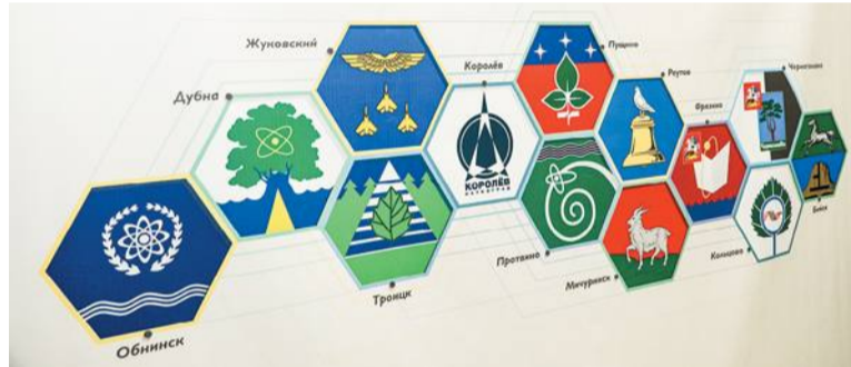
Троицк занимает достойное место среди научных городов России