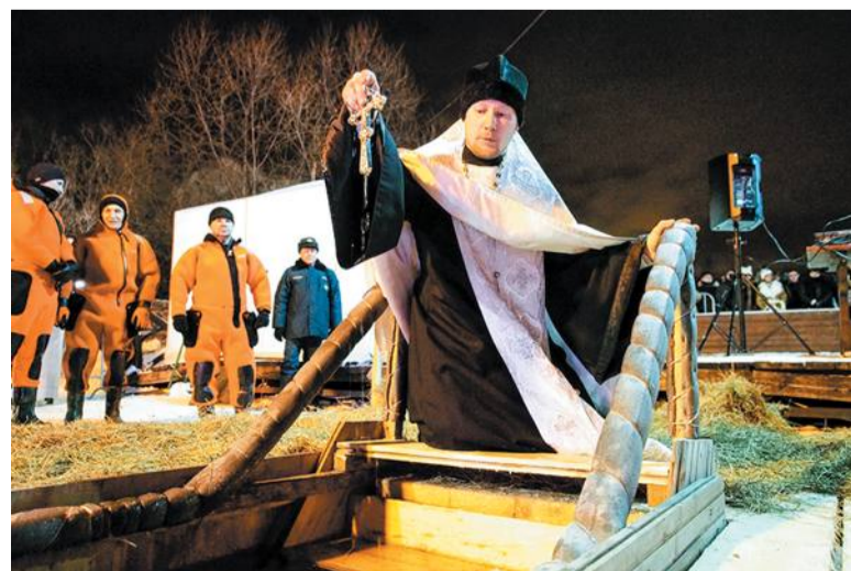
Так традиционно готовились к крещенским купаниям