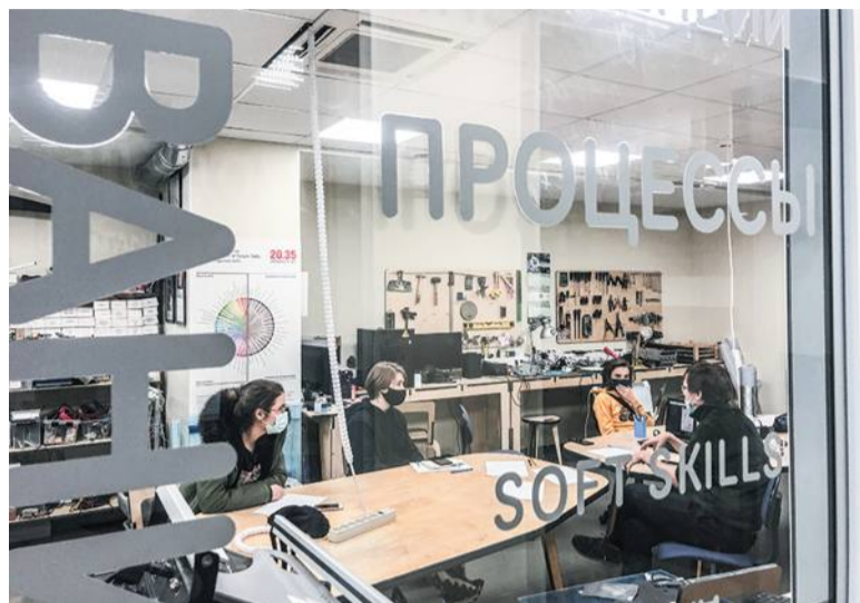
Мозговой штурм проекта «Стрелка в историю»

Две недели троюкие школьники посещали онлайн-встречи с экспертами, выполняли творческие задания и работали над собственными стартапами, потому что стали участниками проекта PRO.TRO. Акселератор дал подросткам возможность показать, как в их представлении выглядит современный Троицк и как решаются его проблемы.