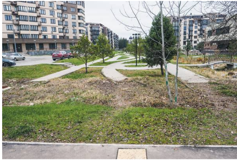
Дорожки в никуда. Примыкания к улице Черенкова пока не сделаны

Улицу Академика Черенкова вот-вот введут в эксплуатацию. Троицкие уже пользуются тротуарами вдоль новой проезжей части: из микрорайона Солнечного по ним удобно выходить на Октябрьский проспект. Да и для прогулок пешеходные дорожки оказались вполне подходящими. Только вот дойти до них со стороны Солнечного проблематично, особенно в дождливую погоду.