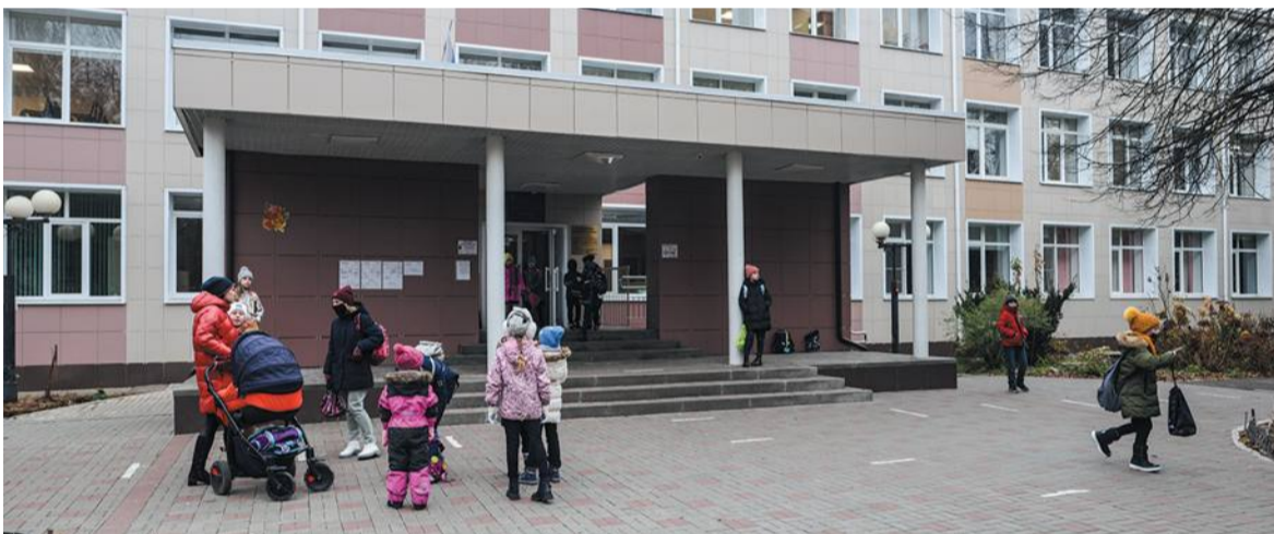
Школьники продолжают учиться: каникулы решено отменить