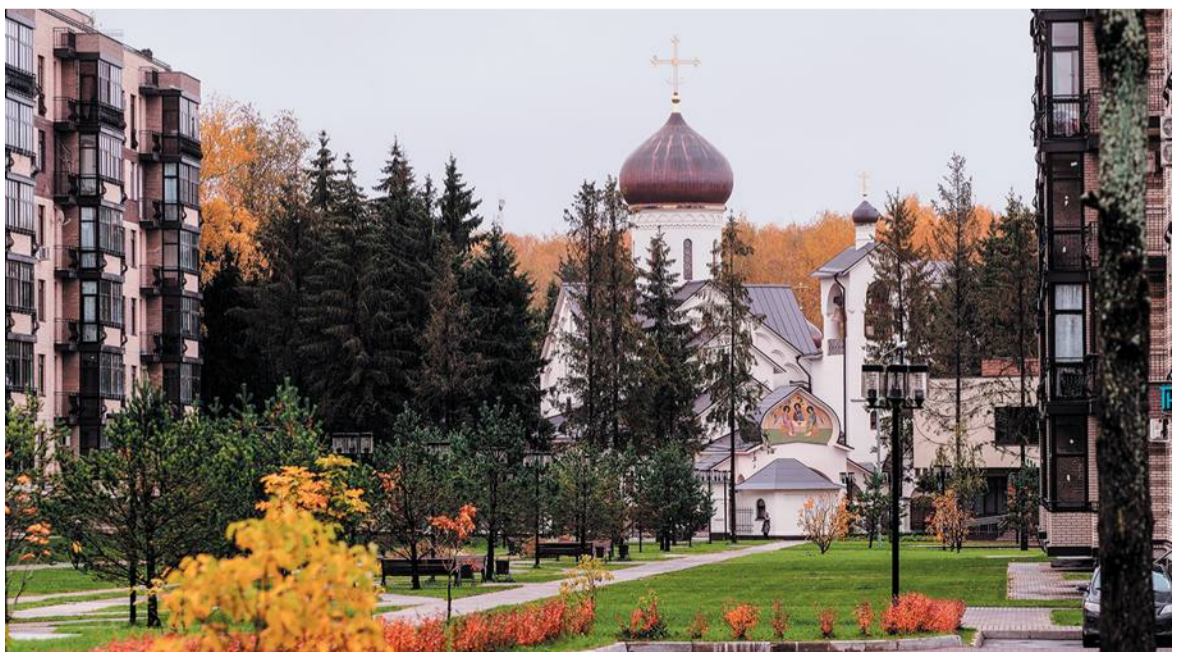
Троицкий храм стал архитектурным украшением города