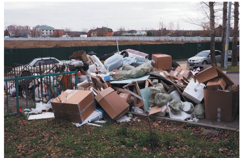
Откуда берутся свалки?

Изначально администрация Троицка помогла сделать здесь площадку для сбора мусора. Но прежняя управляющая компания «УЭК» свои обязанности не выполняла, горы отходов оставались на месте. Из-за этого площадку