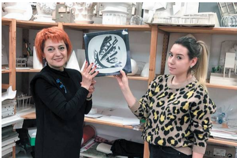
Тарелка за «Линию мысли» от фонда архитектора Якова Чернихова