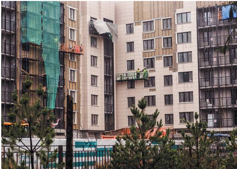
Дома по программе реновации почти достроены

Как в Троицке развиваются программы реновации и капремонта и чем прямые выборы отличаются от назначения «сверху»: эти и другие вопросы обсудили с Владимиром Дудочкиным в прямом эфире телеканала «Тротек» 11 ноября. Передачу посвятили предстоящим выборам главы Троицка, которые состоятся 24 декабря.