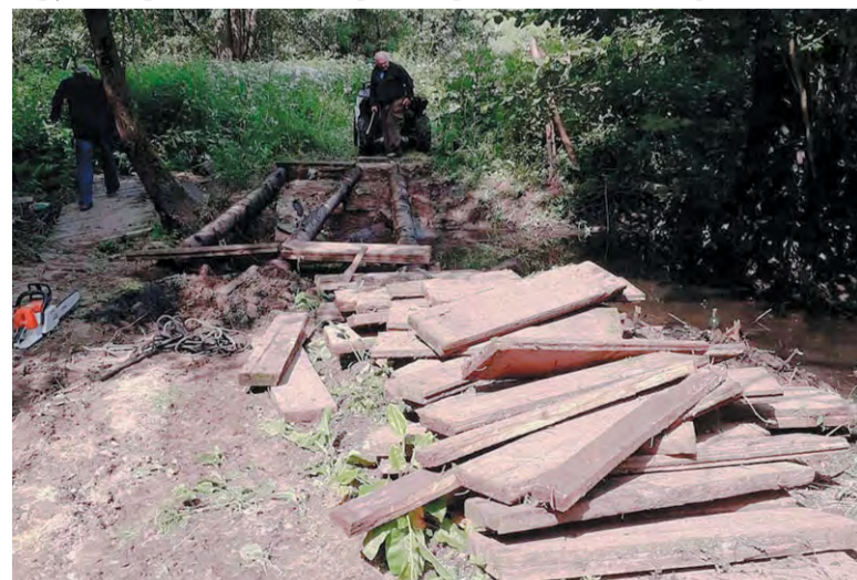
Панда-парк пока восстанавливать не будут. А мост через ручей починили

базы. Анна МОСКВИНА