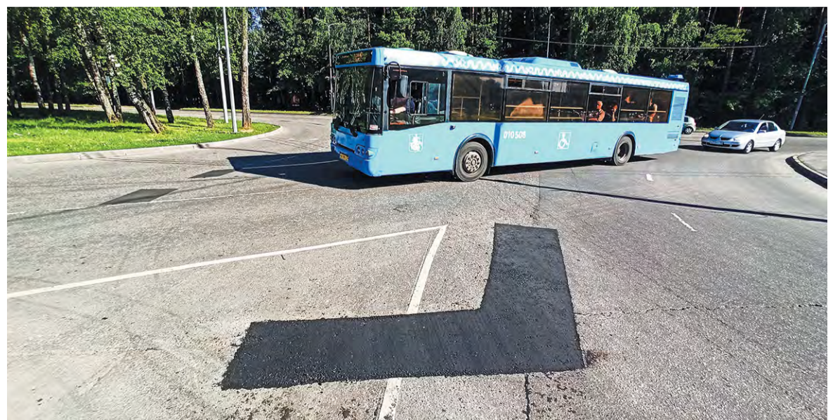
На Центральной асфальтовое покрытие уже отремонтировали