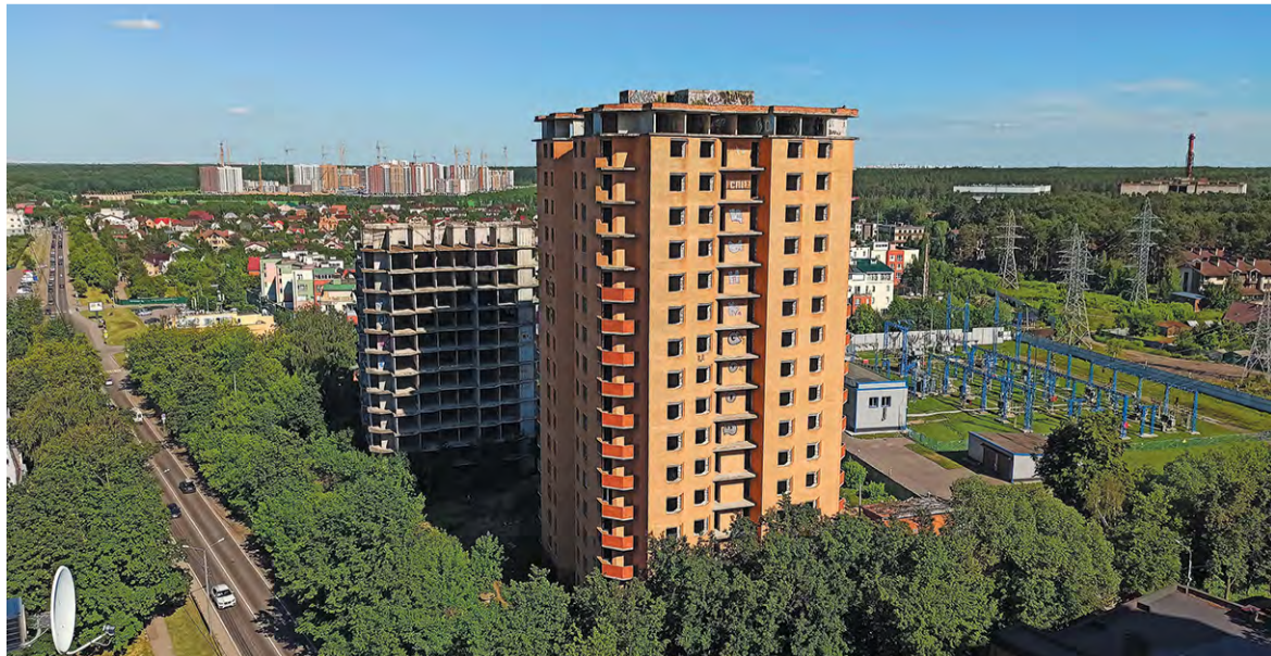
В давно замороженную стройку, похоже, планируют вдохнуть новую жизнь

Наталья НИКИФОРОВА