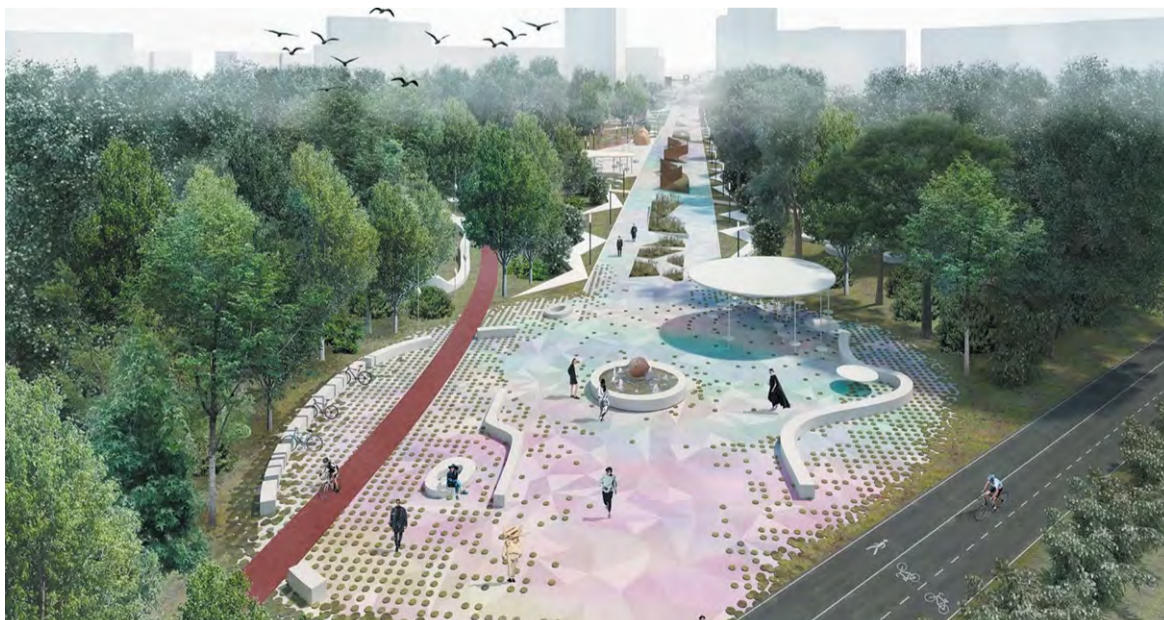
Вариант реконструкции Сиреневого бульвара, предложенный победителями конкурса

На прошлой неделе в полицию Троицка с заявлением обратилась 96-летняя жительница. Она сообщила, что с её расчётного счёта были списаны более 150 тыс. рублей. Сотрудники отдела уголовного розыска задержали 40-летнюю ранее неоднократно судимую женщину, которая была помощницей потерпевшей. На протяжении некоторого времени она, находясь дома у заявительницы, тайно брала телефон и с помощью онлайн-перевода перечисляла деньги на свой счёт. Возбуждено уголовное дело по статье «Кража». В отношении подозреваемой избрана мера пресечения в виде подписки о невыезде и надлежащем поведении.