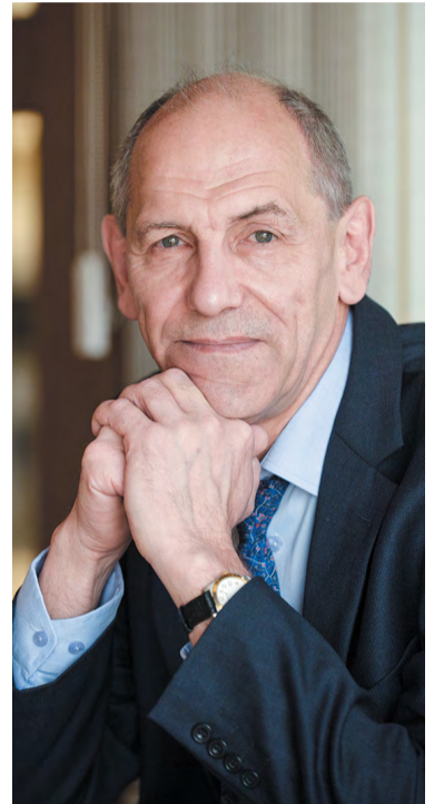
Теоретик ранней Вселенной

Одна из работ, которые принесли академику Рубакову премию, посвящена барионной асимметрии Вселенной. Барионы – семейство элементарных частиц, таких как протоны и нейтроны, составляющие (вместе с электронами) нашу материю. Но когда Вселенная возникла, в ней было поровну частиц и античастиц, почему они не взаимно уничтожились полностью, почему мы существуем? Одно из объяснений – протон может распадаться. Механизм этот предложил в 1976 году будущий Нобелевский лауреат Герард т'Хоофт, но вероятность такого распада безумно мала. А в 1985 году Рубаков, Кузьмин и Шапошников продемонстрировали, что в ранней, очень горячей Вселенной всё было иначе. «Сначала вопрос об этом мне задал Вадим Алексеевич Кузьмин. Я мгновенно ответил, что такого быть не может, потому что была известная статья, которая, на первый взгляд, это явление опровергала. А мысль начала потихонечку крутиться в голове, и оказалось, что при достаточно высоких температурах механизм распада протона работает вовсю. Но после этого ещё лет пять нам никто не верил!» – вспоминает Рубаков.