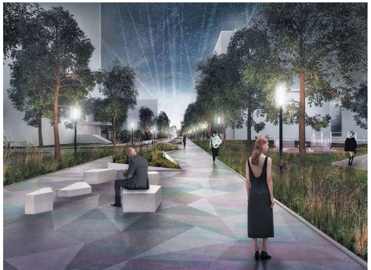
Сиреневый предлагается вписать в алгоритм Вороного

Площадку «Городки» проектировщики видят как место для небольших камерных мероприятий, а зимой здесь может быть каток. Площадку дополнили навесом и развитой системой лавочек.