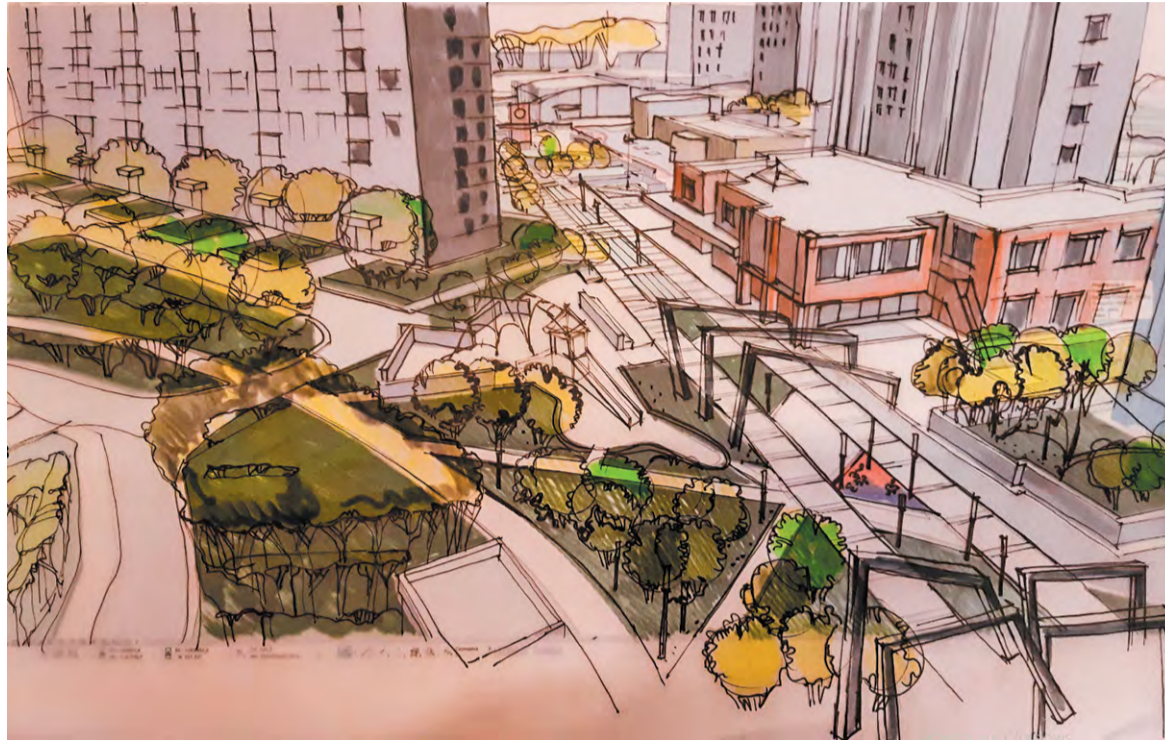
Центральная пешеходная зона Троицка может удлиниться и обрести новыми интересными деталями

Сиреневый бульвар – центральная планировочная ось микрорайона «Б» и всего Троицка,