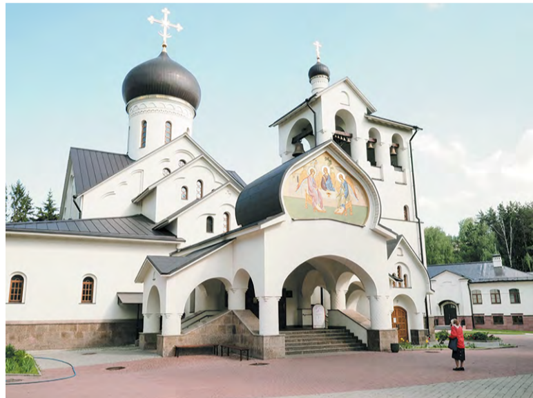
Престольный праздник в храме Живоначальной Троицы. 7 июня 2020 года

огненных языков пламени. «Вплоть до этого дня апостолы имели сомнения. Пётр трижды отрёкся от Христа. Фома сказал: «Если не увижу – не поверю», – напомнил библейскую историю отец Андрей. – Сознанию человеческому сложно было понять происходящее. Господь терпеливо вразумлял и укреплял своих учеников. И потому сегодня мы радуемся началу Церкви». Сошествие Святого Духа стало свидетельством троиственности Бога и наделило учеников Иисуса способностью говорить на разных языках. Апостолы смогли проповедовать жителям разных городов и стран, основав таким образом христианскую церковь и распространив её учение по всей Земле.