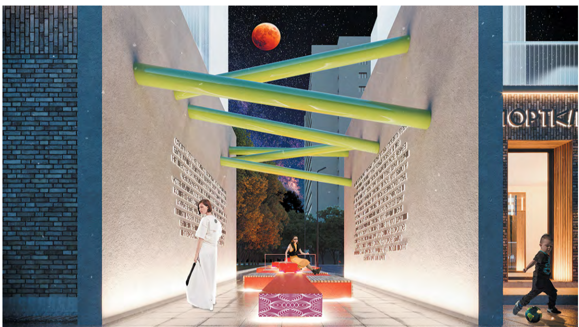
На новом Сиреневом с лёгкостью можно будет делать первые шаги в науку

Сейчас бульвар закрывается автопарковкой со стороны Центральной улицы. Авторы концепции предлагают вынести парковочные места, расположив их по красной линии улицы Центральной, накрыв эксплуатируемой кровлей. По территории бывшей парковки продлить бульвар с зелёными насаждениями, расположить уличный кинотеатр под открытым небом и ярмарочные ряды, что разгрузит потоки на бульваре и обеспечит дополнительный доход в бюджет.