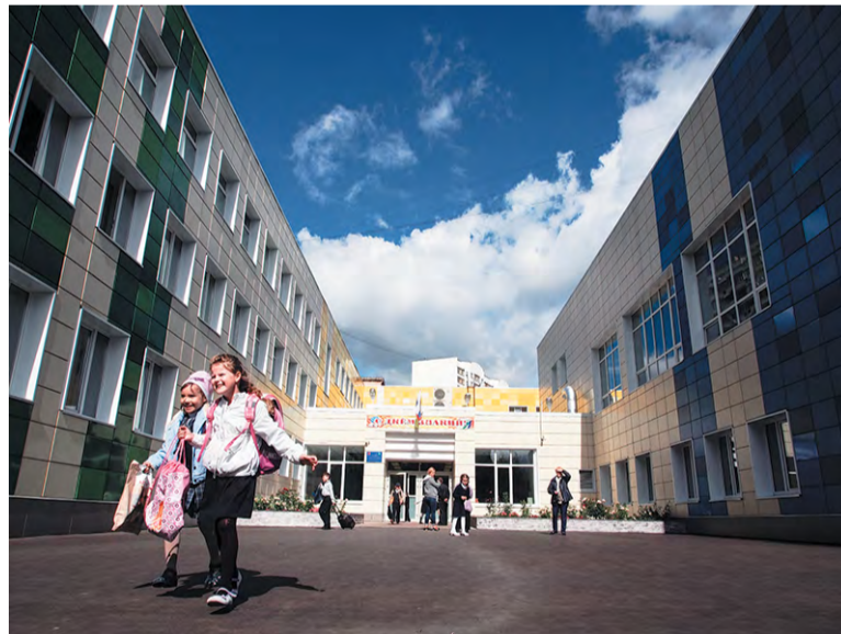
Четверти или пять через одну? Решения пока нет

В начале этого года в образовательных учреждениях Троицка было запущено голосование. Родители должны были выбрать график каникул. Один вариант предполагал сохранить действующую модель, согласно второму дети отдыхали бы от учёбы через каждые пять недель. Второй вариант оказался предпочтительней.