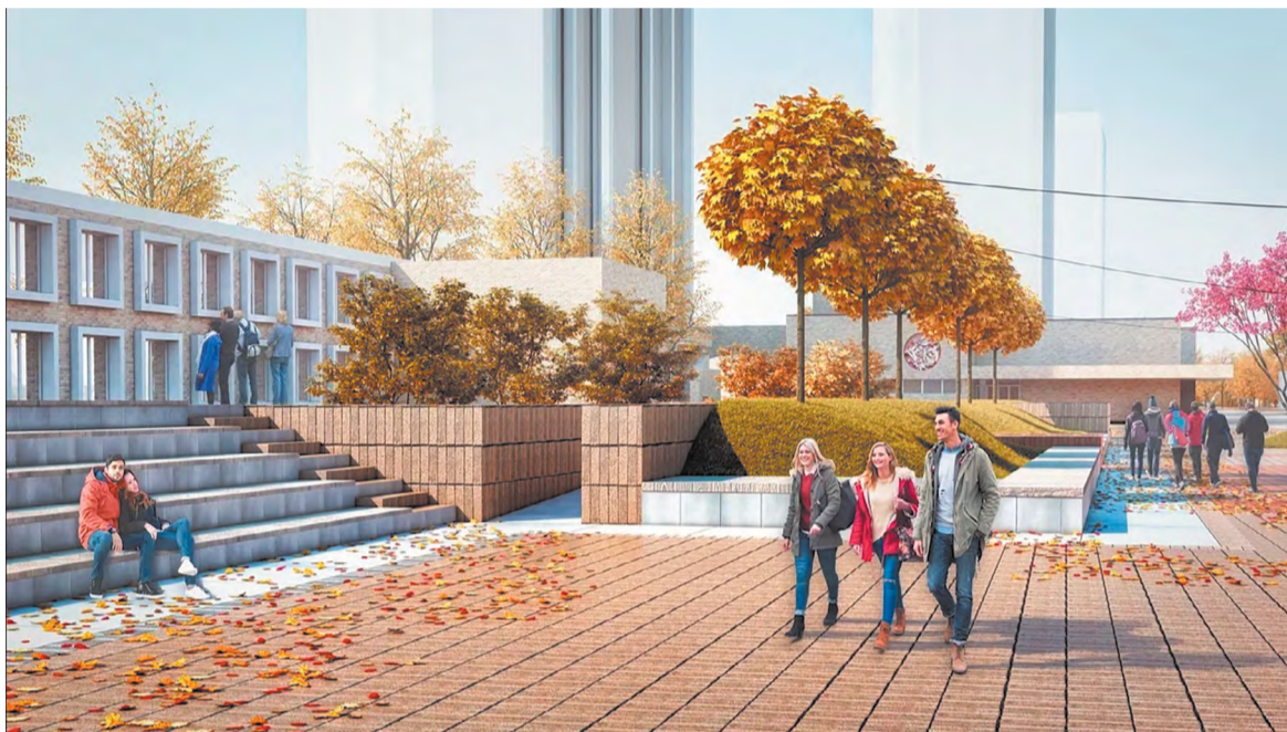
Бульвар сменит ритм. Прогулки перестанут быть линейно-однообразными, можно будет петлять бесконечно

На участках ООПТ предлагается проложить тропинки с покрытием красной или жёлтой кирпичной крошкой, так они станут продолжением архитектурного бренда бульвара.