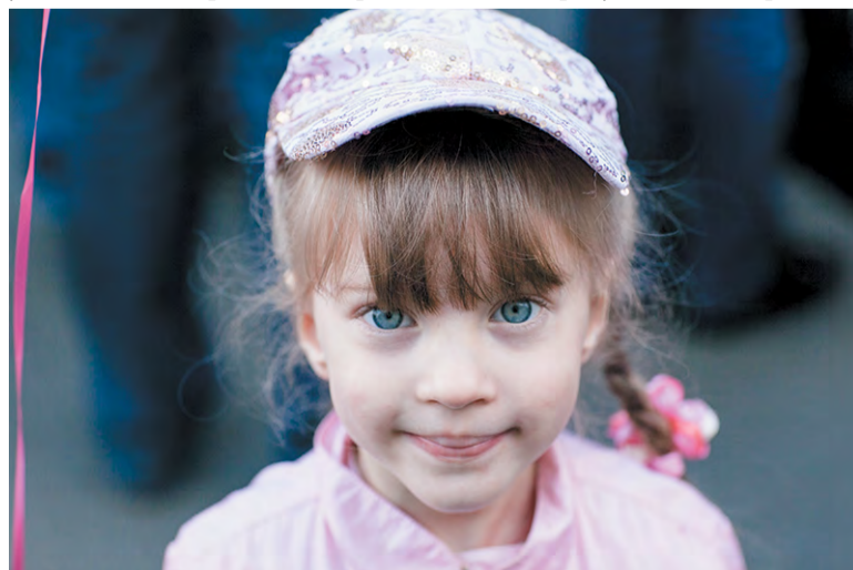
Семьи с детьми от трёх до 15 лет могут рассчитывать на господдержку

Наталья МАЙ