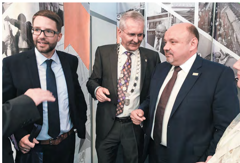
На ежегодной выставке в Вехтерсбахе. 2018 год

В мае, как всегда, в городе-побратиме Троицка немецком Вехтерсбахе готовилась выставка-ярмарка, где делегация нашего года вот уже несколько лет в числе почётных и желанных гостей. Эта ярмарка должна была стать ярким событием в жизни обоих городов: там планировалось отметить 75-летие Великой Победы. Но из-за коронавируса запланированные мероприятия пришлось отменить.