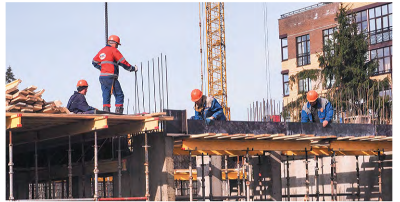
Микрорайон Солнечный: дома по программе реновации вновь строятся