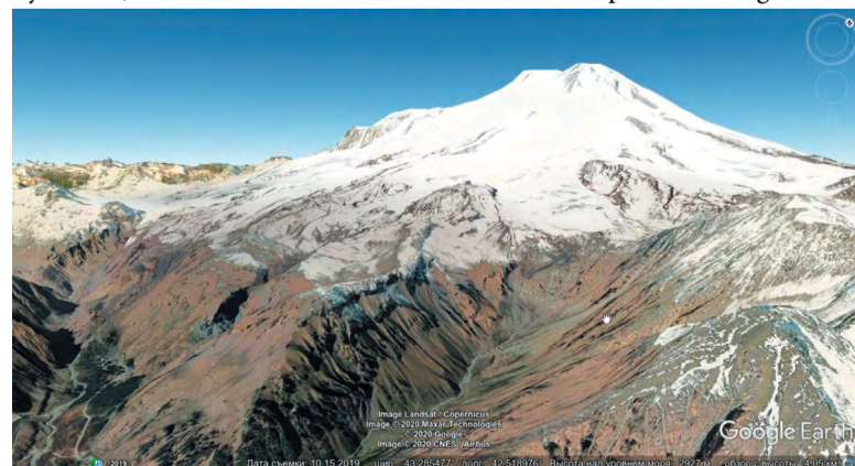
Виртуальное путешествие с видом на Эльбрус