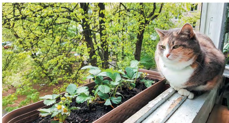
Клубничная балконная плантация Тамары Строковой