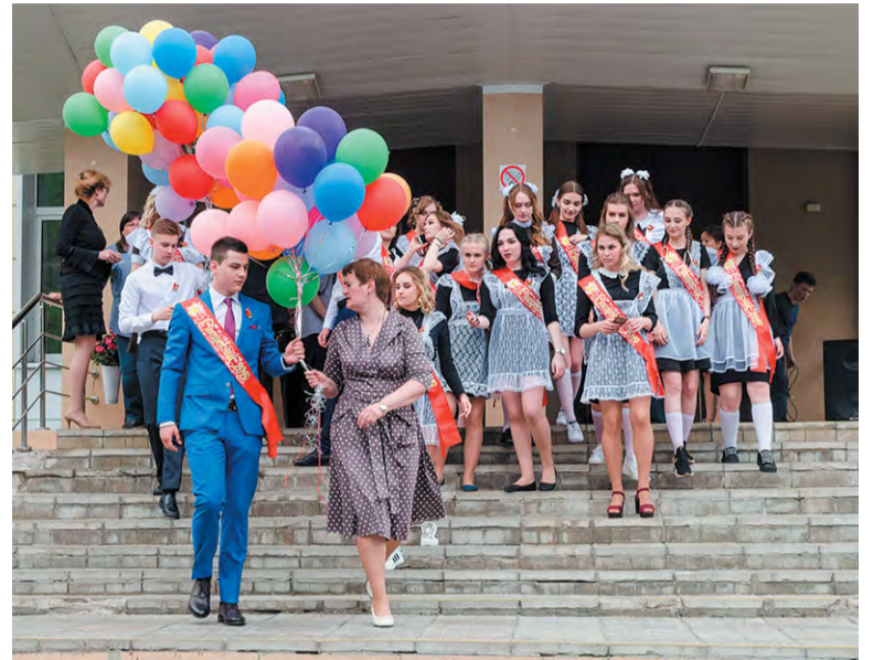
Последний звонок в прошлом году выглядел так. В этом всё будет иначе

Итак, согласно Указу мэра Москвы №55-УМ от 07.05.2020 годовые отметки школьникам выставили 15 мая. В следующие две недели ученикам не выпускных классов предлагается обучение в режиме свободного посещения. Если родители примут решение о необходимости продолжить учёбу, ребята будут заниматься обобщением и повторением ранее