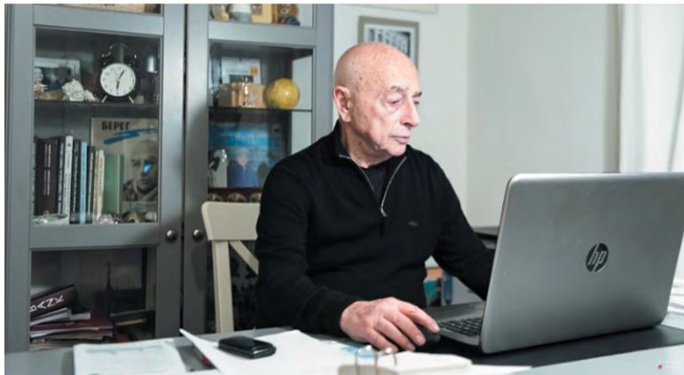
Александр Городницкий в самоизоляции. Ноутбук – окно в большой мир

Александр Городницкий в Троицке бывал не раз: и как учёный – посещал ИЗМИРАН и ИЯИ, и как автор-исполнитель – в нашем городе проходили его концерты. А сейчас, во время самоизоляции, приехать невозможно, но пообщаться с нашей публикой он всё равно сумел. Для этого и существуют «Музыкальные посиделки» на телеканале «Тротек».