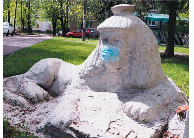
Сфинкс, символ Троицкого музея, тоже соблюдает правила

А вот для Троицкого музея переход в онлайн стал новым шансом. Прежде всего – на расширение. Раньше посетители едва умещались в двух небольших комнатах на Нагорной, 9. Виртуальные стены безграничны, а выставок можно разместить сколько угодно. Сейчас на сайте troickmuseum.ru – видеоэкскурсии «Памяти павших» и «Их провожал фабричный гудок», фотогалереи «Имя тебе – победитель», «Ветераны города Троицка» и «Письма с фронта»... Подготовить их помог городской Совет ветеранов.