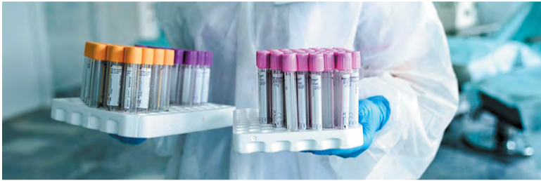
Новый анализ позволяет узнать, есть ли у человека иммунитет к COVID-19

15 мая в столице стартовала новая программа исследований – тестирование граждан на наличие иммунитета к коронавирусу. Об этом накануне сообщил на своей странице в соцсети мэр Москвы Сергей Собянин, и в этот же день москвичи стали получать смс-сообщения с приглашением пройти обследование. Среди них есть и жители Троицка.