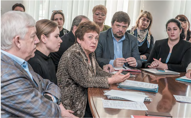
Секция «Социальная сфера» собрала педагогов, учёных, музыкантов...

В 2017 году Троицк продлил статус наукограда, для чего в 2016-м был принят фундаментальный документ – Стратегия социально-экономического развития Троицка до 2032 года. Прошло четыре года, и настал момент её актуализировать – то есть учесть, какие её проекты шагнули вперёд, какие – застряли на месте или «ушли в песок», а какие, наоборот, за это время появились.