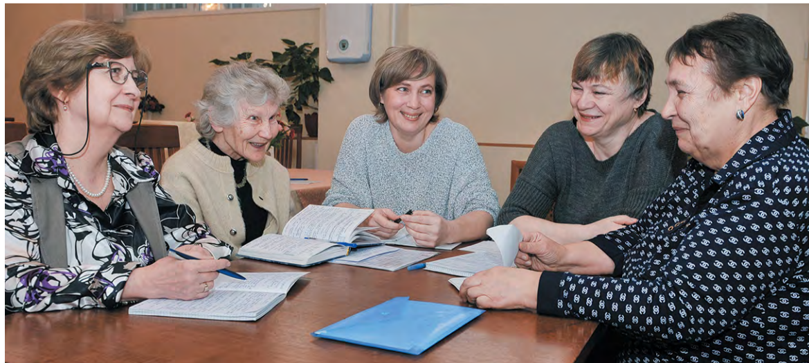
Хорошую историю стоит рассказать всем