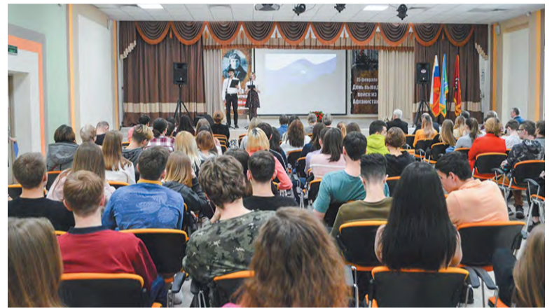
Тишина в зале. Со сцены звучит последнее письмо