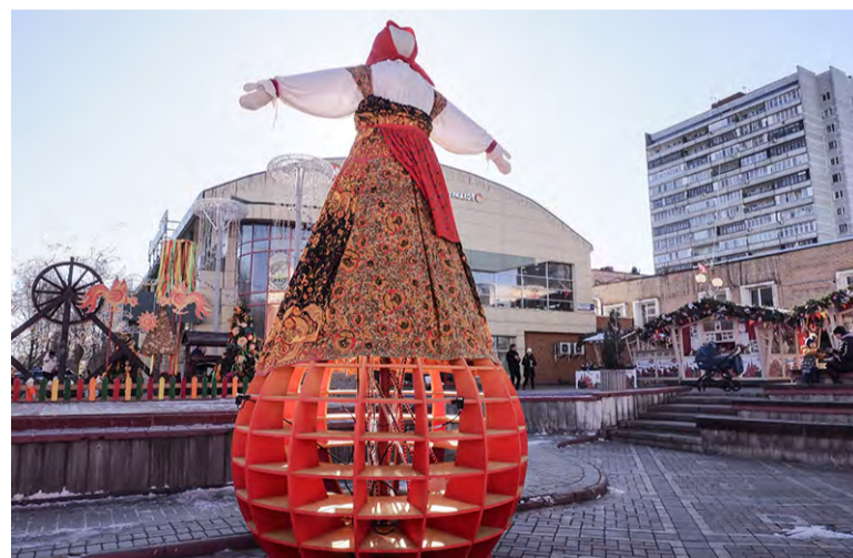
Масленица на Сиреневом бульваре видно издалека

Троицк снова стал одной из площадок фестиваля «Московская Масленица». На сцене – тематические спектакли, в кулинарном шале столичные повара готовят вместе с детьми блины и другие вкусности. В торговых павильонах продают сувениры и деликатесы.