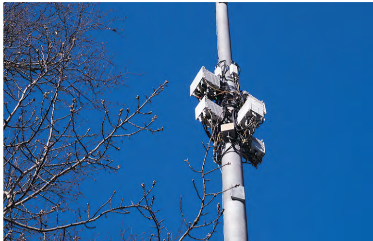
Так выглядят вышки базовых станций сотовой связи

На улицах Троицка уже немало вышек, увешанных разнообразным оборудованием. Конструкции довольно часто вызывают недовольство горожан, поскольку смотрятся неказисто. Зачем они нужны и насколько аппаратура безопасна для здоровья, обсудили в городской администрации. На совещании присутствовали представители сотовой связи, Департамента информационных технологий столицы и компании «Вертикаль», которая занимается установкой и обслуживанием вышек.