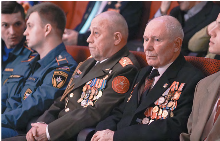
Торжество для воинов всех поколений