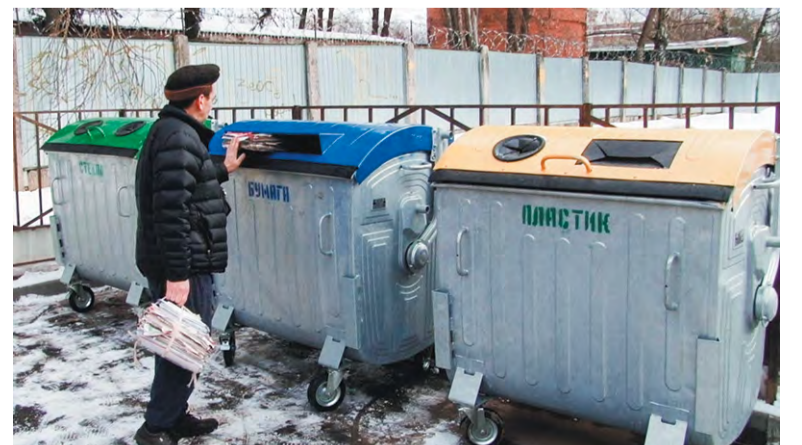
Контейнеры для раздельного сбора мусора появились во всём городе