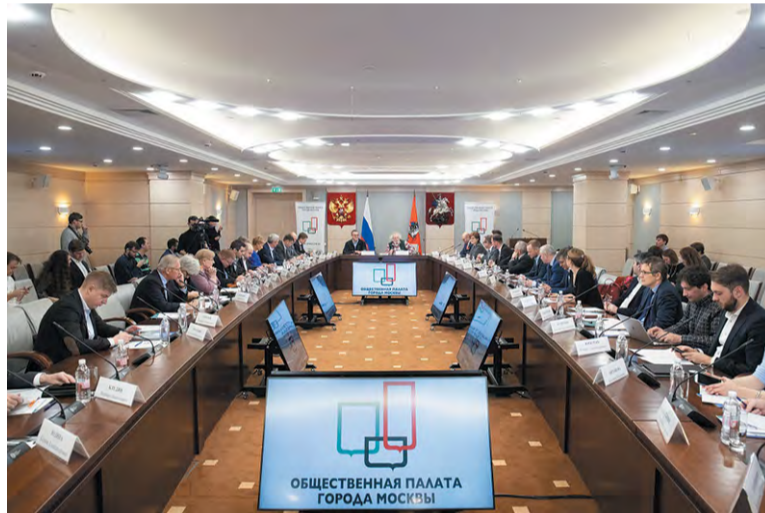
Судьбоносное заседание. Консенсус достигнут: решение за троичанами

Светлана МИХАЙЛОВА