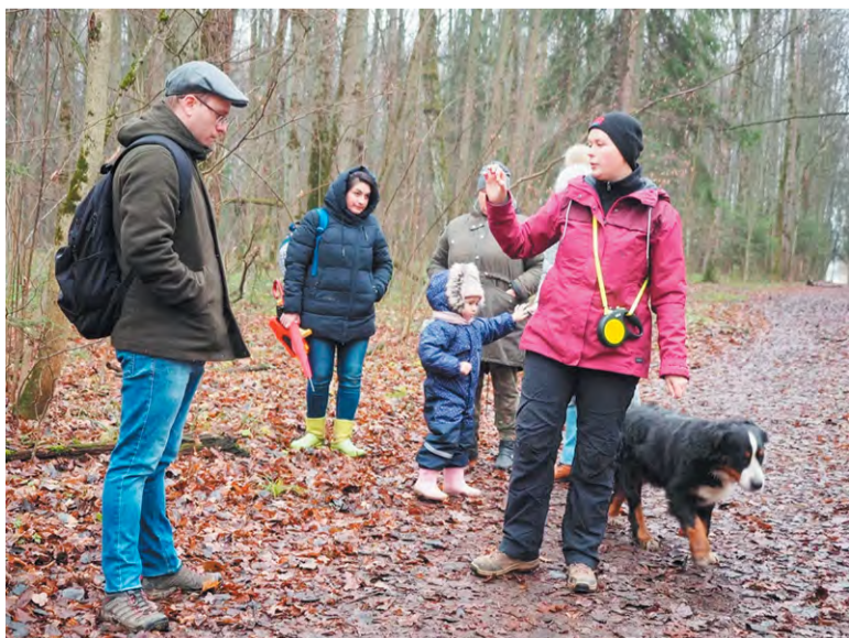
Вяз, ясеня, тополь, дуб... как научиться узнавать деревья научит Кристина