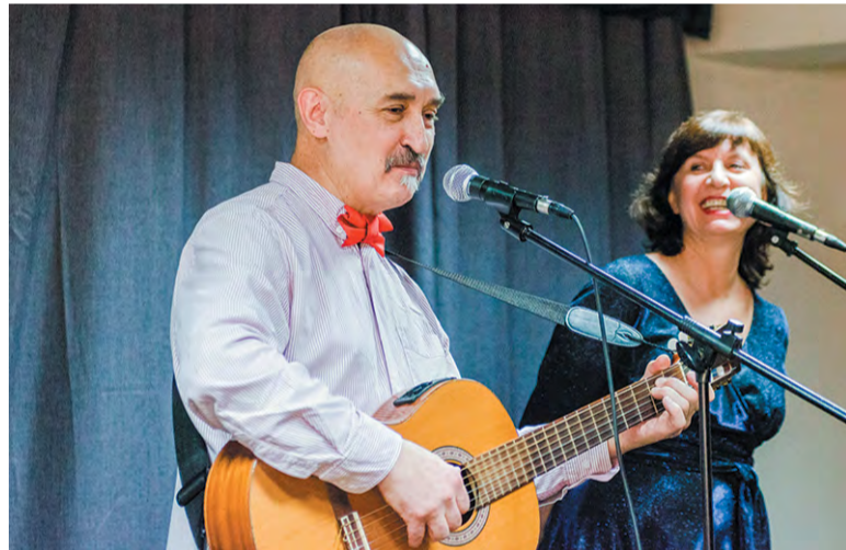
«Ты моё дыхание...» Это была первая совместная песня будущего дуэта