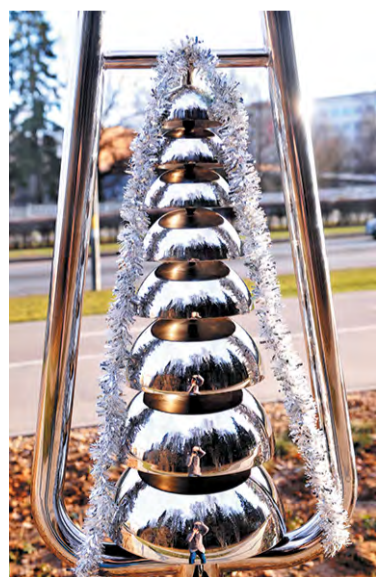
Новые МАФы выглядят декоративно