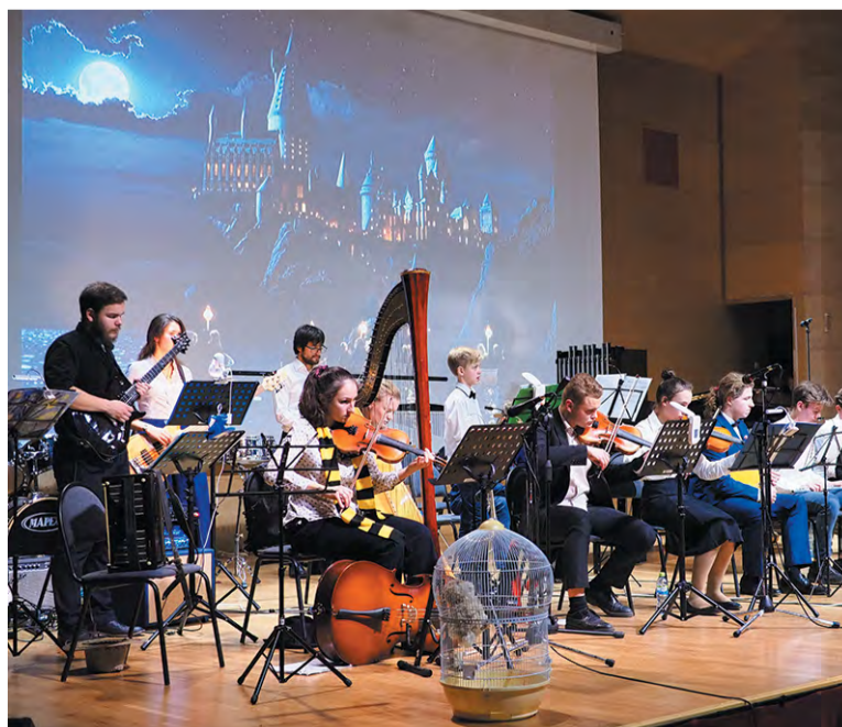
Сова на сцене и замок на экране: играют музыку к «Гарри Поттеру»

К музыке из «Гарри Поттера» в зал принесли клетки с совами, правда, игрушечными. А к «Пиратам Карибского моря» декорации и вовсе масштабные. На сцене появились паруса, верёвочные лестницы и штурвал. А вот пиратский флаг стал музыкальным: на нём вместо костей и черепа – флейты и гитарный гриф. Каждый раз преобразовались и сами музыканты. То они в ковбойских шляпах, то в шарфах Гриффиндора, то в пиратских повязках.