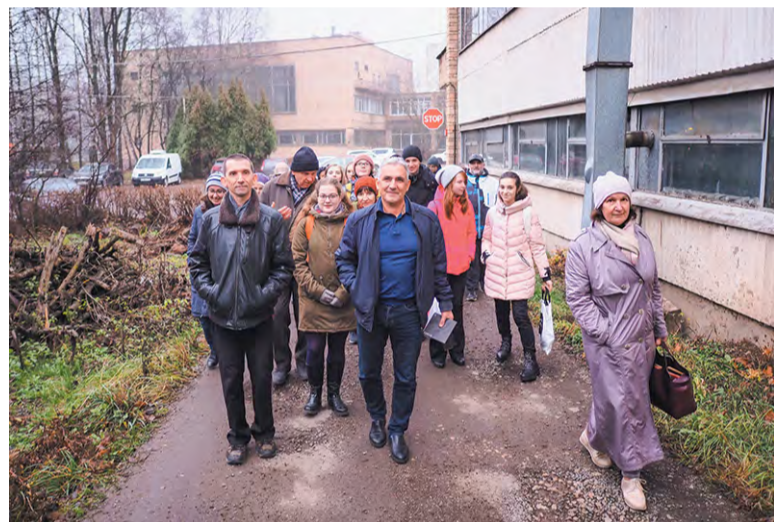
Экскурсия в ИФВД собрала рекордное количество участников