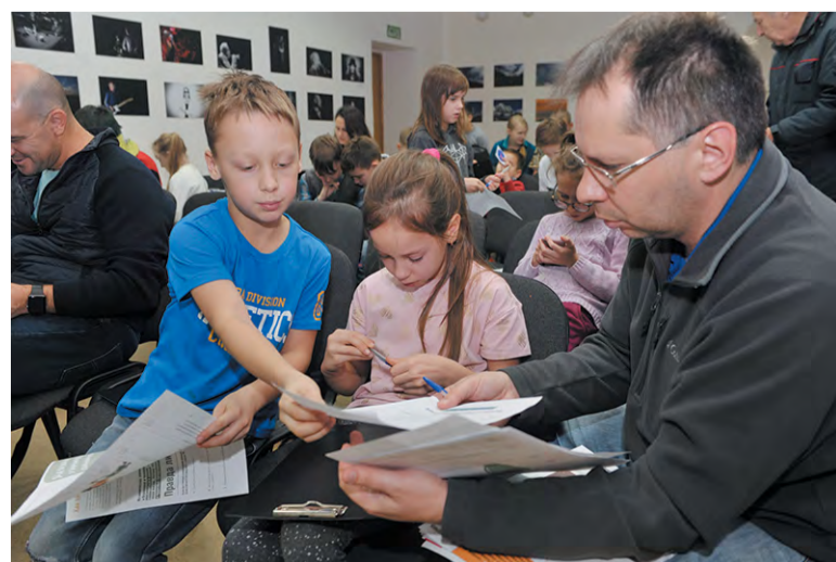
Троицкий Дом учёных стал одной из 20 площадок Химлабы в Москве

Светлана МИХАЙЛОВА