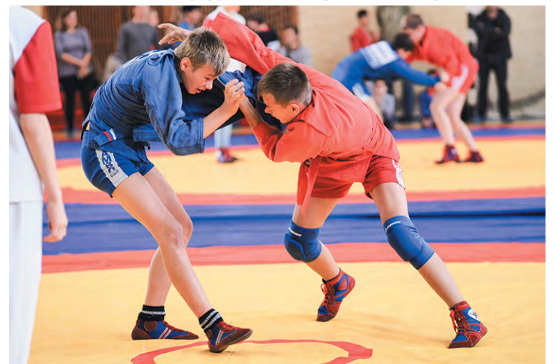
Поединок за место в сборной