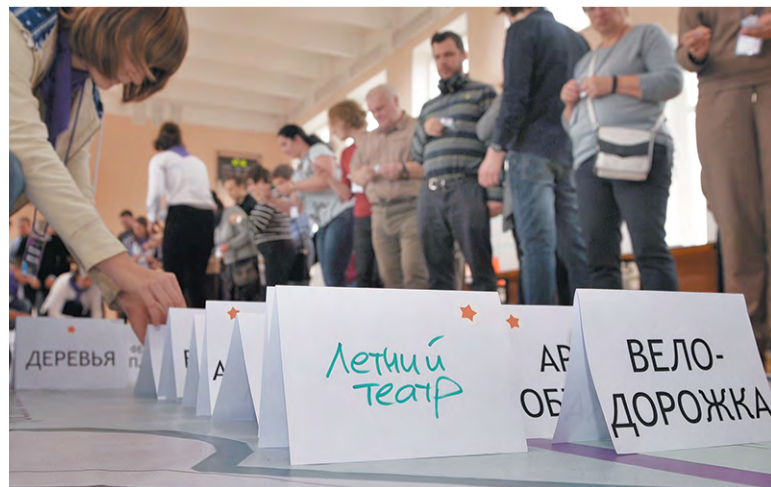
Пазл для горожан: собери свою улицу

Светлана МИХАЙЛОВА