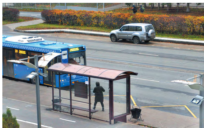
Горожанам не хватает на Октябрьском симметричной остановки