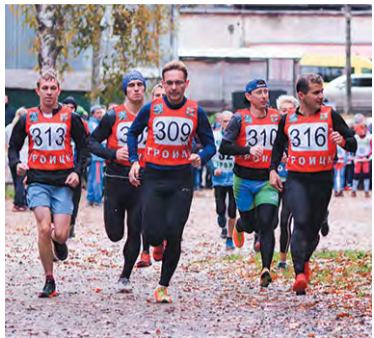
Старт на 21 км

«Троицкая осень» – не только время года. Многие спортсмены знают полумарафон с таким названием. В нынешнем году на базе «Лесной» его провели уже в пятый раз. Собралось больше сотни участников, но дистанцию в 21 км покорили только сильнейшие.