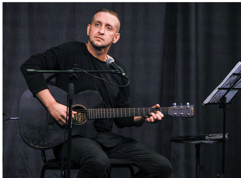
Филипп Август: «Твой крейсер «Галактика» в моём душном космосе»

шенно самостоятельный, зрелый музыкант, со своей стилистикой и особой песенной манерой. Инструментом владеет виртуозно, совсем не по-бардовски – профессионально. Какие-то вещи звучат