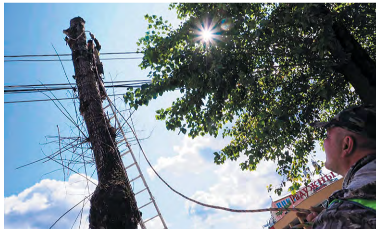
Срубить сухое дерево сложнее, чем можно подумать

«Почти все они попали в перечень по заявкам горожан. Так, на улице Пушкиных после обращения жителя несколько деревьев уже подготовили к вырубке. Они помечены