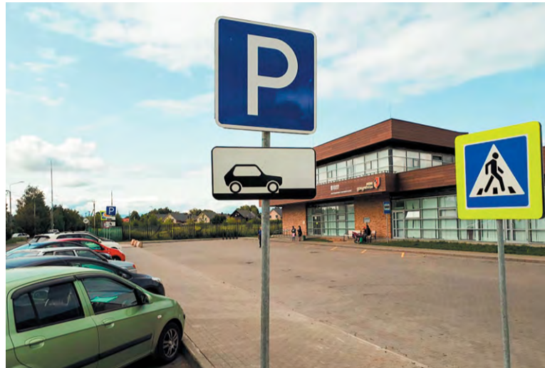
На личном автомобиле ко входу в МФЦ теперь не подъехать

автомобили. Водителям приходится высаживать пассажиров прямо на проезжую часть, а разворот делать только в конце улицы», – комментирует замглавы города