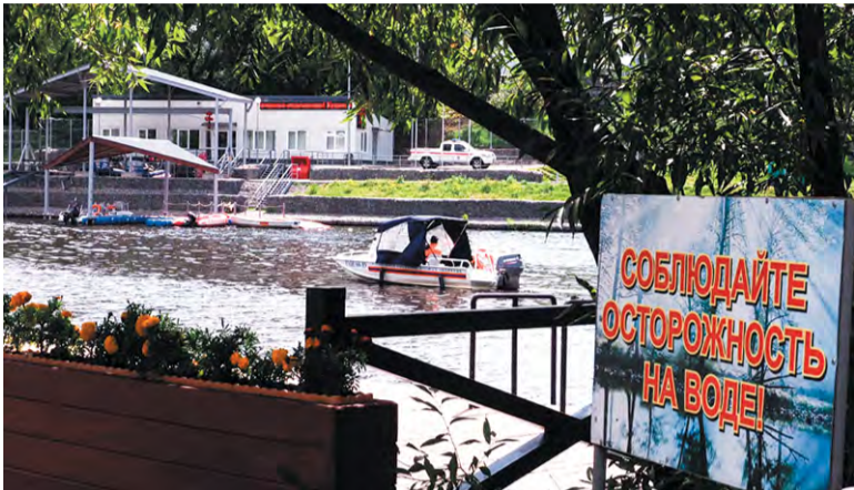
«Заречье»: купаться запрещено!

Около 80% жителей, пострадавших в этом году на Десне, были пьяны! Поисково-спасательная станция «Троицкая» просит полицейских организовать в «Заречье» постоянное патрулирование. Эта тема одной из первых была рассмотрена на заседании комиссии по ГО и ЧС, которая прошла в администрации во вторник, 6 августа.