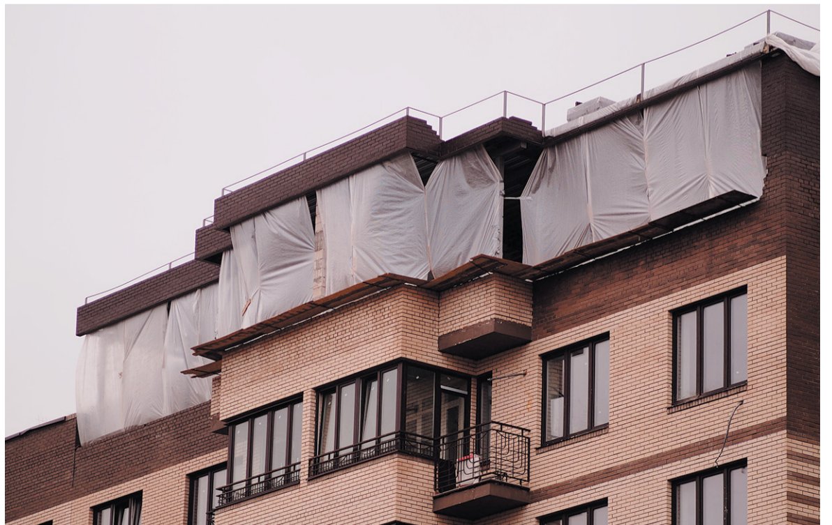
Застеклённые неотапливаемые веранды на верхнем этаже будут построены в едином стиле