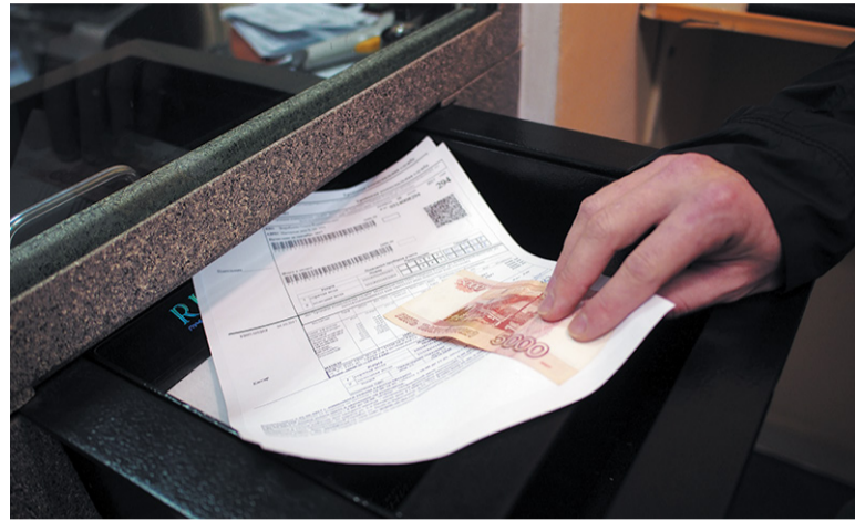
Сумму платежа теперь можно рассчитать заранее

Расценки на услуги ЖКХ повышаются ежегодно. При этом у большинства горожан частенько возникают вопросы: за что, собственно, мы столько платим. При этом со структурой тарифа на содержание жилого фонда можно ознакомиться на сайте своей управляющей компании, а выяснить, сколько ресурсов использовано по факту, гораздо сложнее. Жители не могут вычислить сумму платежа за тепло или воду. Администрация готова помочь потребителям в решении этой проблемы.