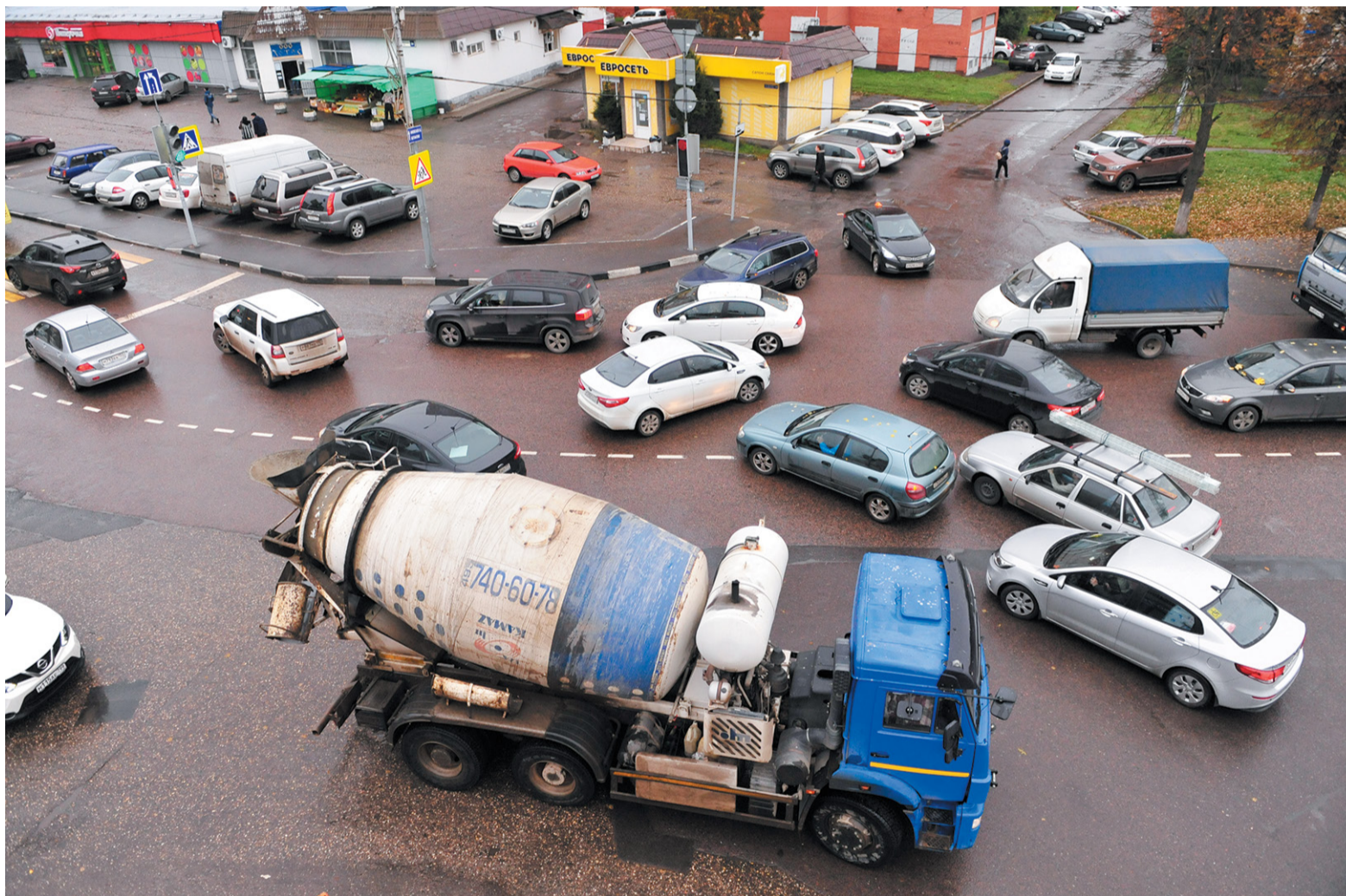
Броуновское движение на управляемом перекрёстке

С приходом осени жизнь автомобилистов стала напряжённой, как и городской трафик. Троицк стоит в пробках. На мобильных картах улицы нашего города ярко-красные в часы пик. Исправить положение может только строительство новых дорог. Тогда «зеленеет» и участок, известный в народе как перекрёсток у «Кнакера»,