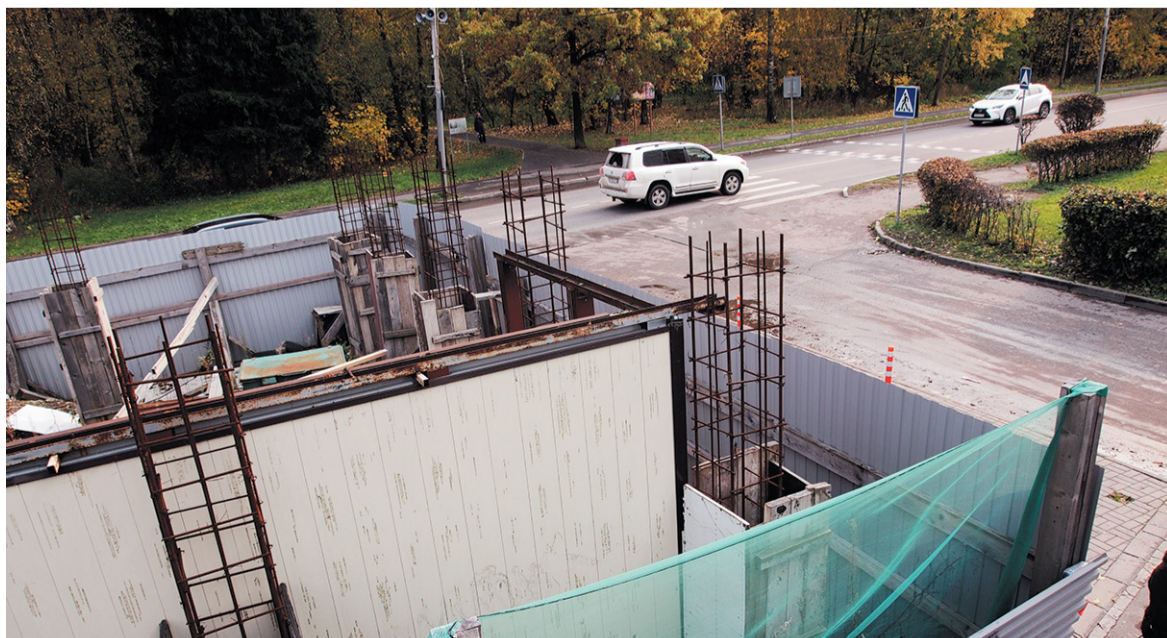
Непарадные виды улицы Центральной

Наталья НИКИФОРОВА, фото Александра КОРНЕЕВА