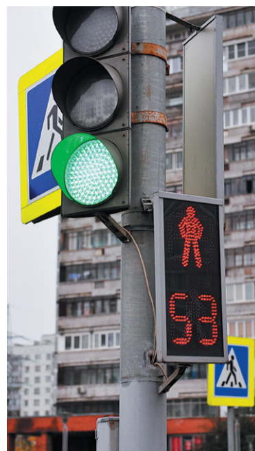
Всё работает. Пробки тоже