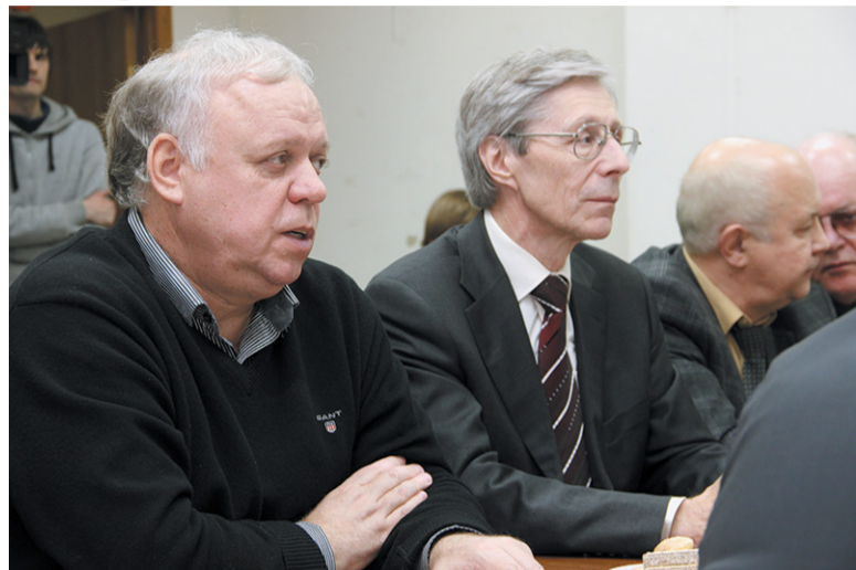
Школа учителей физики – союз педагогов и учёных

60 учителей физики пройдут обучение в нашем городе в дни осенних каникул. Десять – из троичских школ, ещё 50 – лучшие педагоги столицы. Первая троичская школа повышения квалификации преподавателей физики «Актуальные проблемы физики и астрономии: интеграция науки и образования» стартует 30 октября.