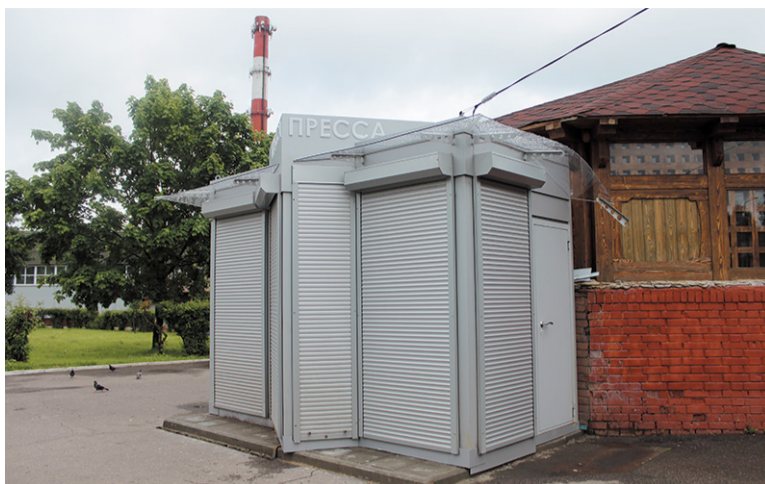
Новые киоски готовы к работе