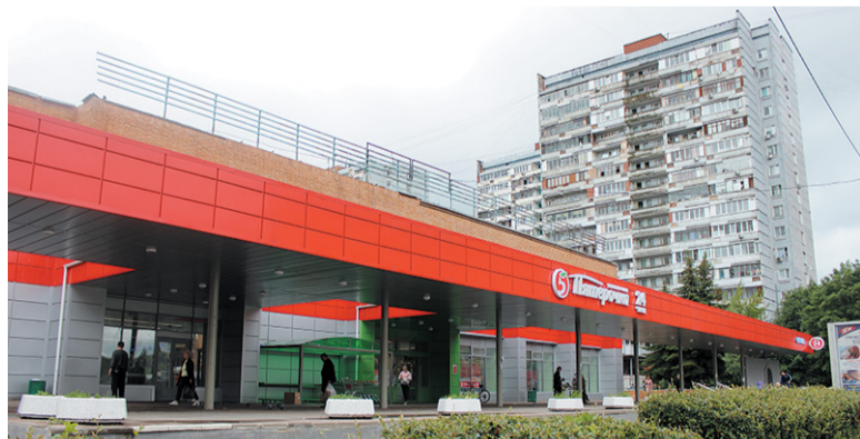
За неправильно размещённую вывеску – штраф от 50 тыс. рублей

Большие мигающие экраны, светодиодные бегущие строки, уличные штендеры и баннеры. Уже более двух лет в Троицке ведётся борьба с навязчивой рекламой, портящей архитектурный облик зданий. За это время было демонтировано порядка 500 конструкций. А недавно в постановление правительства «О размещении информационных конструкций» внесли новые требования, которые вступили в силу 1 июля.