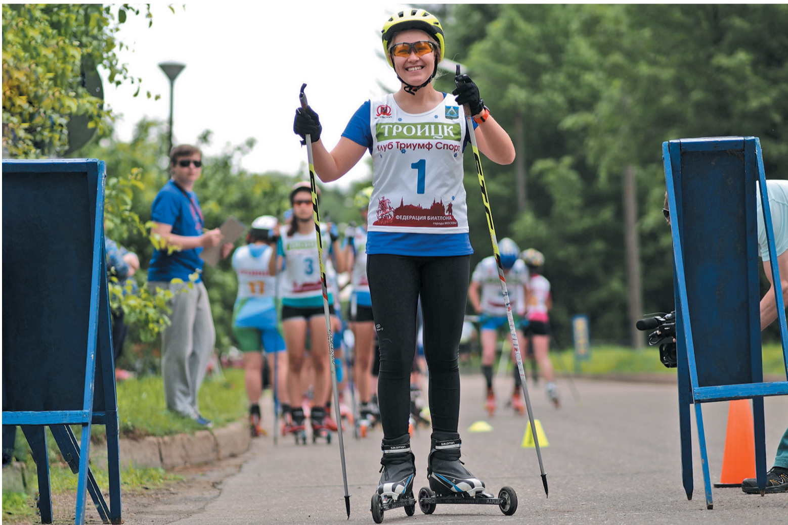
Новую лыжероллерную трассу в Троицке обкатали чемпионы России

Пять лет назад Троицк стал Москвой. 1 июля 2012-го границы столицы расширились и к ней присоединили Троицкий и Новомосковский округа. Знаменательную дату в городе отпраздновали сразу двумя большими соревнованиями. В «Заречье» устроили турнир по пляжному волейболу с участием всех поселений Новой Москвы. А на