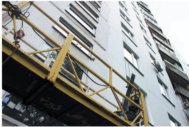
До и после. Разница налицо