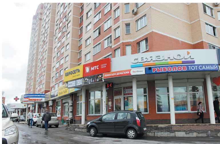
«Кричащие» вывески демонтируют

Наталья НИКИФОРОВА