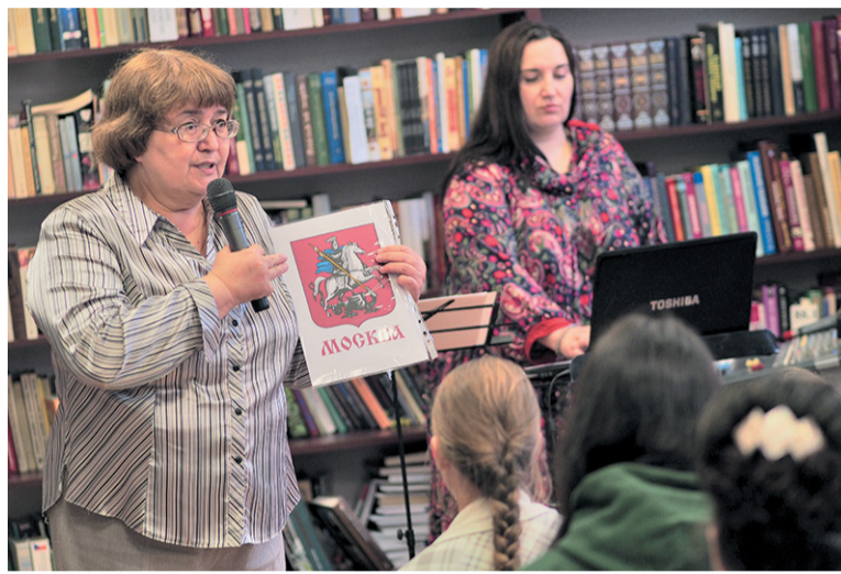
Троицк теперь в Москве. Жителям надо знать историю обоих городов

ТиНАО отмечает свой первый юбилей. Пять лет назад в состав Москвы вошли 21 поселение и два городских округа. В том числе – Троицк. В нашем городе этому событию посвятили небольшой камерный концерт. Изначально его планировали провести на улице, но погода вновь внесла свои коррективы: вокальный коллектив «Хит» Центра «МоСТ» выступал в зале библиотеки на Сиреневом бульваре.