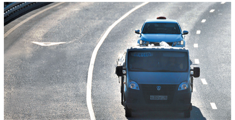
С 14 января за движение по выделенной полосе штрафуют

Отметим, что в ПДД чётко определено, что выделенная по-