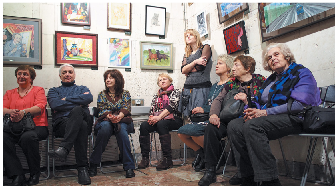
На стенах Выставочного зала встретились работы двух творческих студий