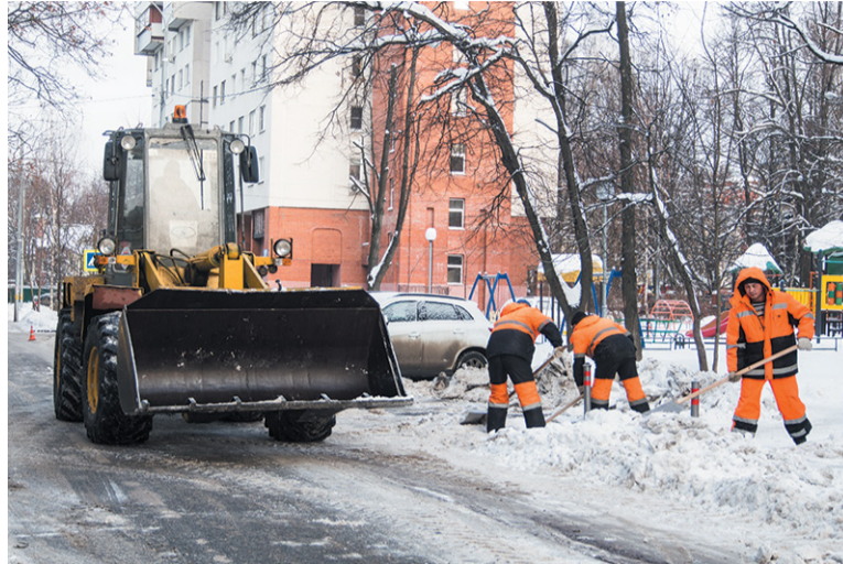
Снежные завалы разгребают и вручную, и с помощью техники

Новогодние праздники позади, горожане вышли на работу. А вот коммунальщикам отдыхать было некогда. Все каникулы они провели на посту. Уже 1 января после обеда дворники вышли на борьбу с последствиями снегопадов. Параллельно чистили крыши от снега и сосулек.