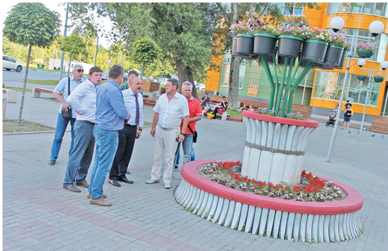
Участники рейда обсуждают грядущую реконструкцию площади

Благоустройство города продолжается. За качеством пристальное наблюдает глава города. Свой недавний рейд он начал с обследования въезда на 41-м км.