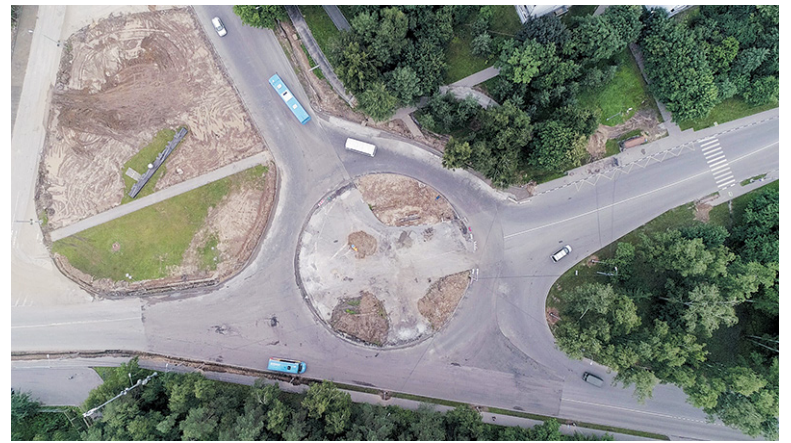
Автобусы, грузовики, легковые машины: места хватит всем

Те, кто уже не раз здесь проезжал, на круг заходят уверенно. К хорошему горожане быстро