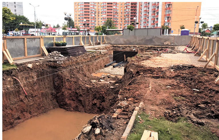
К Дню Москвы здесь появится главное украшение площади

Светлана МИХАЙЛОВА