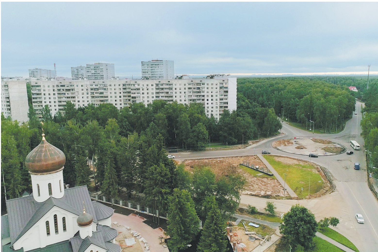
Новый облик города: храм, удобные дорожные развязки, отсутствие пробок

Тех, кто не был в Троицке несколько дней, ждёт сюрприз. Схема движения одного из основных перекрёстков круто изменилась. Проблемный узел «Центральная – Физическая – Солнечная» трансформировался в круг. Со стороны Солнечной на Центральную нельзя съехать, как раньше, повернув налево. Теперь навигатор