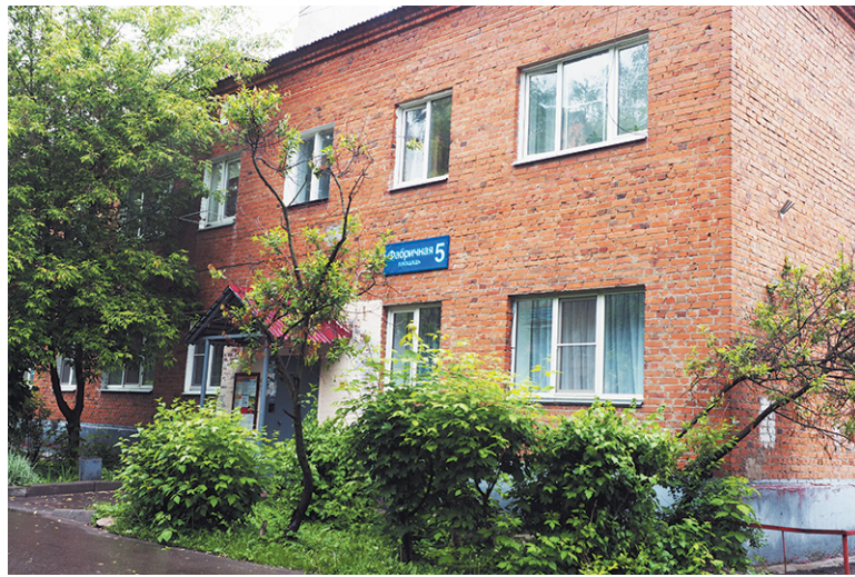
Дом отремонтирован. И всё же жители голосуют за снос

Жильцам пятого дома на Спортивной принять окончательное решение тоже оказалось непросто. И хотя протоколы голосования уже в администрации, во дворе дома по-прежнему бушуют страсти. «Я, конечно, не доживу.