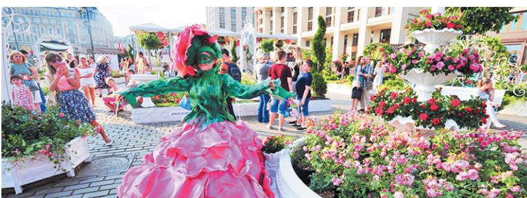
Вальс цветов и праздник сладкоежек